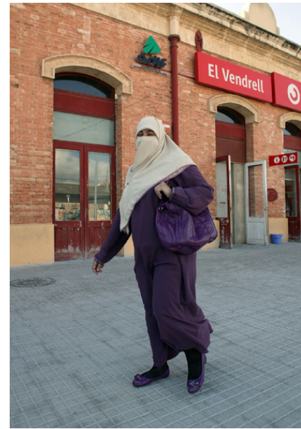
Figura 6: El País (12/04/2011):

< http://www.elpais.com/articulo/opinion/modelo/frances/sirve/elpepiopi/20110412elpepiopi_12/Tes >