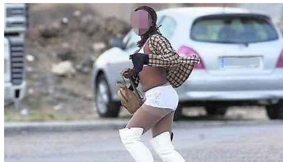
Figura 3: ABC , 04/03/2011:

Merece la pena destacar que en los dos ejemplos de representación fotográfica (figuras 3 y 4) de las trabajadoras sexuales (ambas de ABC ); al parecer, se sacaron las fotos sin el permiso – y parece, sobre todo en el primer caso, contra la voluntad – de estas mujeres. Sirve para ejercer violencia sobre ellas, cosificándolas con el énfasis en su cuerpo, y vulnerando sus derechos.