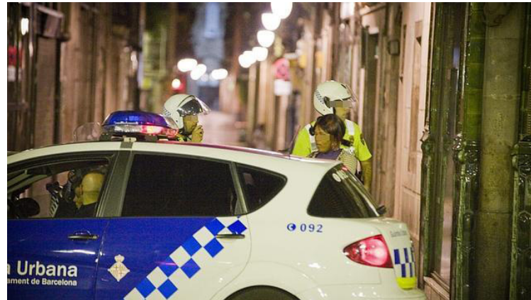
Figura 7: ABC, 08/02/2011:

"Detención de una sospechosa en Ciutat Vella" en El PP asegura que se esconden datos sobre inmigración < http://www.abc.es/20110207/local-cataluna/abci-barcelona-dice-ocultan-datos-201102071059.html >