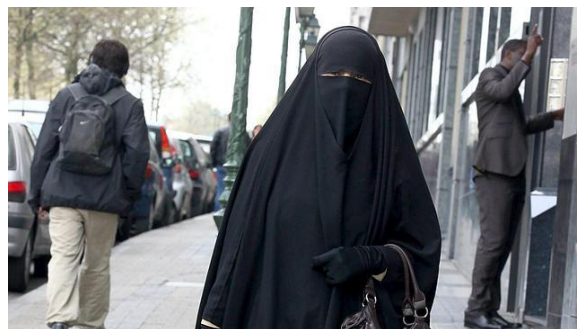
Figura 5: ABC: 08/03/2011

< http://www.abc.es/20110308/espana/abci-burka-generalitat-201103081742.html >