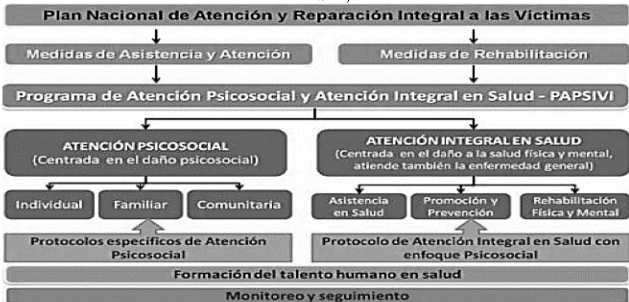
FIGURA 1. PLAN NACIONAL DE ATENCIÓN Y REPARACIÓN INTEGRAL A LAS VÍCTIMAS

El conjunto de actividades, procedimientos e intervenciones interdisciplinarias diseñados por el Ministerio de Salud y Protección Social para la atención integral en salud y atención psicosocial. Podrán desarrollarse a nivel individual o colectivo y en todo caso orientadas a superar las afectaciones en salud y psicosociales relacionadas con el hecho victimizante.