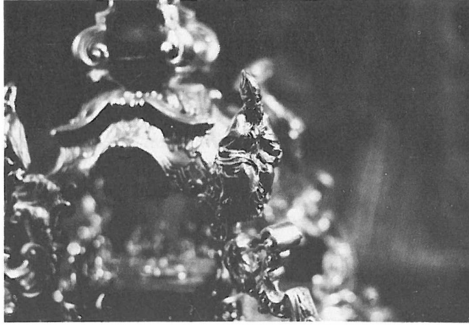
Custodia de 1778. Detalle. Doctor de la Iglesia Latina. Museo de la Capilla Real. Granada.