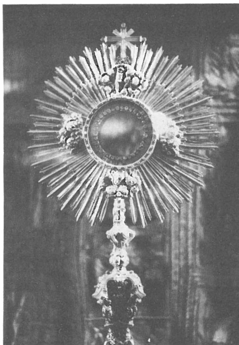
Custodia de 1778. Detalle de la parte superior. Museo de la Capilla Real. Granada.