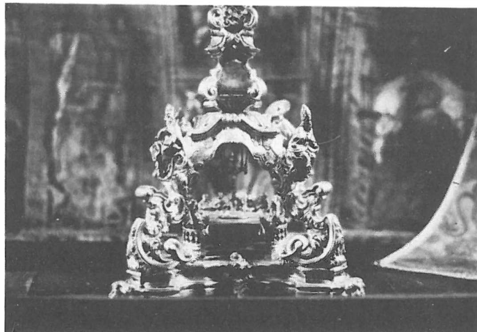
Custodia de 1778. Detalle de la Capilla que formaba la base. M. de la Capilla Real. Granada.