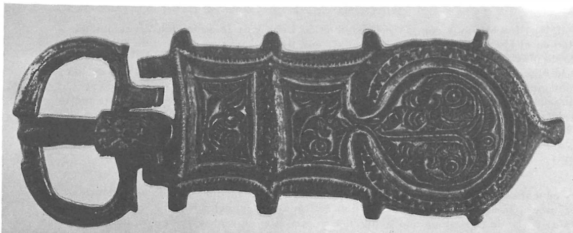
Fig. 1. Anverso y reverso del broche.