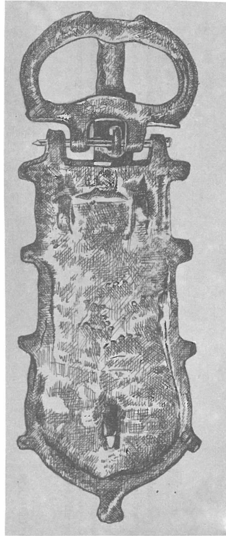
Lám. 1. Broche de cinturón visigodo procedente de Villanueva de Mesía.