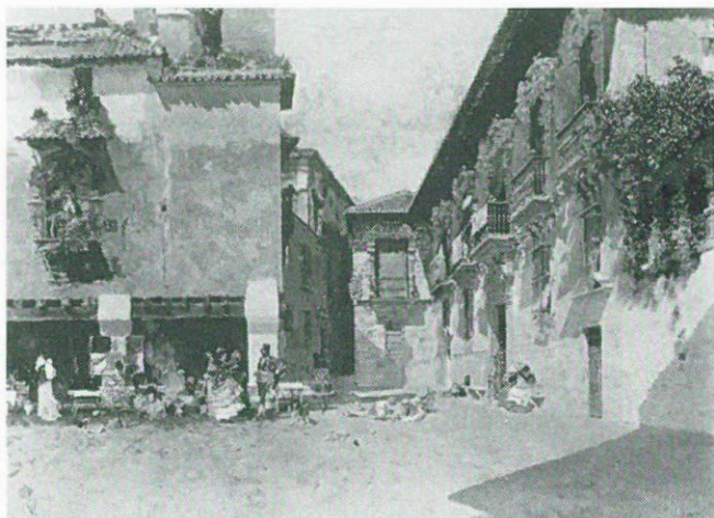
3. Boceto definitivo para Ayuntamiento Viejo de Granada .

yacente, está inserto en una estructura, que rematada por un tejadillo y flanqueada por dos faroles, se resuelve con trazos finos y paralelos. En el calco que para el cuadro se conserva en el Museo de Arte de Cataluña se esboza el mismo motivo en la fachada del edificio. Ciervo 15 reproduce un boceto del cuadro en el que todavía no están incluidos los personajes que llenan la plaza, pero sí a parecen los dos edificios, uno de ellos con el grupo escultórico. También existe un boceto titulado Virgen de las Angustias y de la Piedad que debe ser para esta misma escultura, así como un estudio a lápiz en una colección particular.