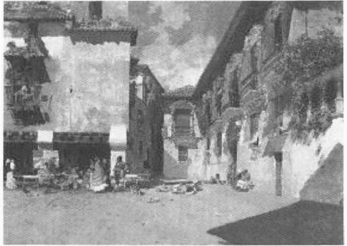
4. Obra definitiva de Ayuntamiento Viejo de Granada .

En alusión a los datos económicos y a la trayectoria artística en el mercado del arte de la obra de Fortuny tengo que advertir que la subasta de este cuadro batió cualquier puja conocida en la cotización del pintor desde hacía más de veinte años, siendo sobrepasada únicamente por la tela titulada Fantasia árabe en Tánger que se revendió en Junio de 2000 en la sala Sotheby's de Londres por quinientos trece mil doscientos ochenta y dos euros, habiendo sido subastada en 1987 por esa misma casa en Nueva York alcanzando un precio de doscientos doce mil quinientos catorce euros.