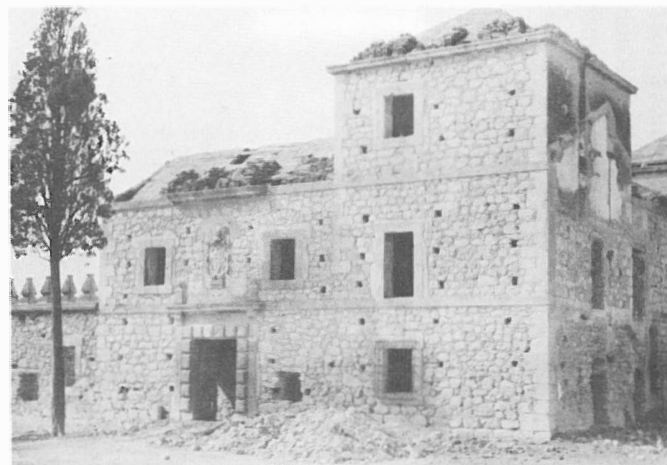
Fig. 6.- Fachada principal con la mampostería vista y las cubiertas en reconstrucción. (Tomada a finales de 1985)