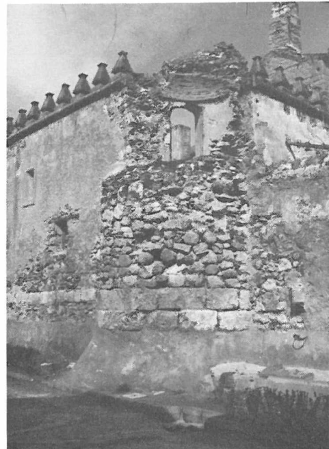
Fig. 2.- Cubo de uno de los ángulos que quedaron destruidos en el terremoto que tuvo lugar en la Navidad de 1884. Antes de su restauración