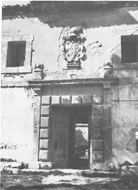
Fig. 5.- Detalle de las ventanas y puertas principales de piedra de cantería y labrada con el escudo de la familia Pérez de Aroxtegui en la parte superior

Tan nobles aspiraciones y tan loable labor para salvar el monumento de su total destrucción son aspectos dignos de resaltar y admirar, resultando éste así un ejemplo claro de cómo se rescata una obra para el Patrimonio Histórico Artístico de España, anteponiéndose para ello los intereses del bien común a los puramente personales.