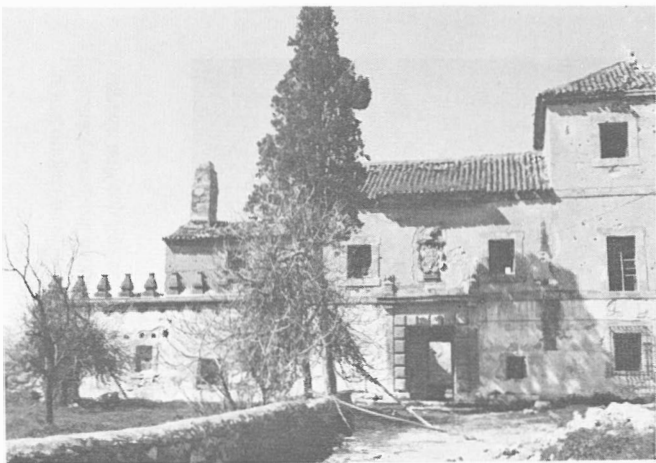
Fig. 1.- Castillo-Palacio: vista general de la fachada principal. (Tomada a finales de marzo de 1984 antes de comenzar la reconstrucción)