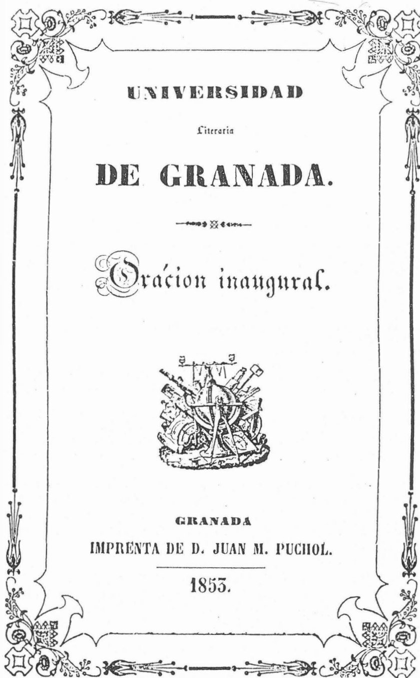
Fig. 4.- Oración inaugural de la Universidad Literaria de Granada. Ejemplo de orla romántica