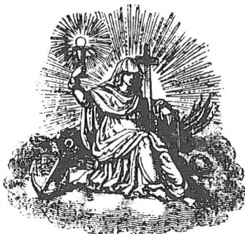
Fig. 2.- Viñeta de fin de capítulo en la obra de Miguel Lafuente Alcántara “ Historia de Granada, comprendida la de sus cuatro provincias. Almería, Jaén, Granada y Málaga desde remotos tiempos hasta nuestros días ”. Sanz. 1843

tido, la proliferación de repertorios teatrales o la entusiasta acogida que tendrán las novelas fragmentadas o por entregas).