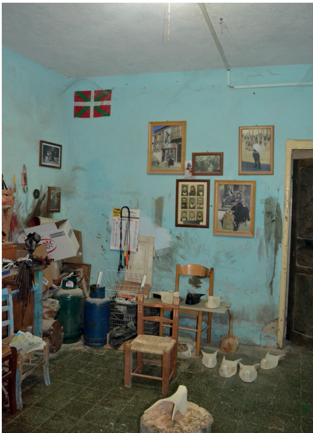
6. Laboratorio de máscaras “boes e merdules” en Ottana. 16 de enero de 2017.