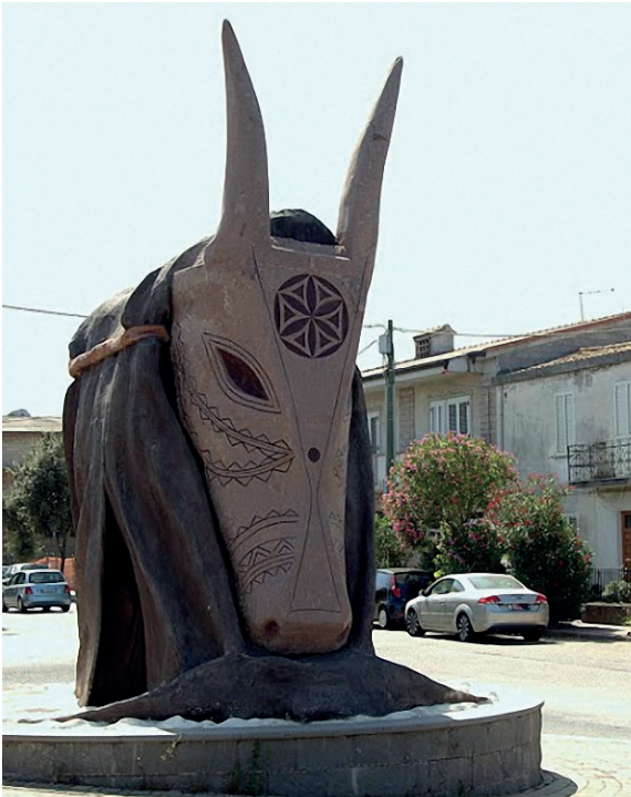
3. Estatua “boes e merdules” presente en la entrada de Ottana. Fotografía del autor, 4 de agosto de 2016.

El valor del “objeto” se puede comprender entonces observando su relación con el debate local sobre las posibilidades futuras de la comunidad, y en este debate ha sido fundamental el proceso que ha llevado a la “certificación” del valor patrimonial de la máscara y su éxito económico-turístico, ya que han legitimado el discurso identitario que hemos visto surgir.