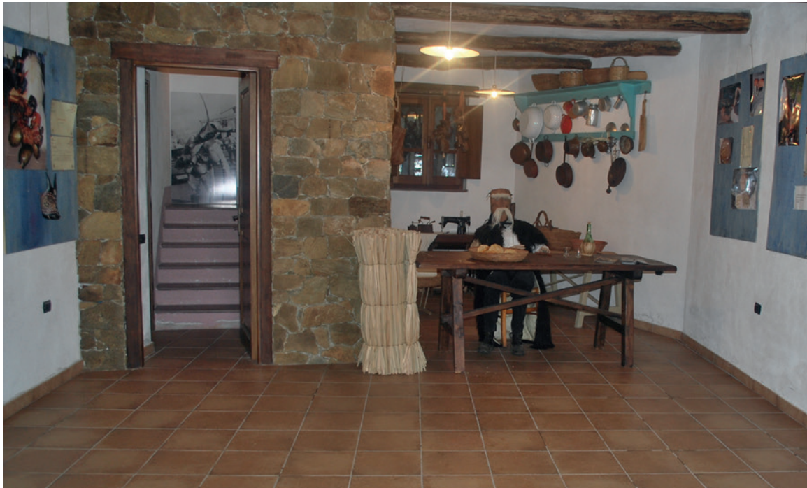
5. Iniciativa privada del “museo generalizado”. Fotografía del autor, 7 de febrero de 2016.

[...] es desde hace unos años que intentamos valorizar el carnaval. La verdad es que nos molestaba ser el pueblo de la industria. Parecía que Ottana era sinónimo de industria. Cuando nos preguntan ¿eres de Ottana? ¡Ah, donde está la industria! ¡Ya basta! Con la administración pasada nos pusimos a trabajar para el carnaval. Primero con la DOC y luego entró la Universidad para colaborar, y nos dieron una gran ayuda. También el trabajo de Bentzon se hizo con ellos, y ahora las fotografías se exponen en todo el pueblo en un museo generalizado. [...] a partir de este texto, tenemos que empezar a organizarnos con proyectos ligados a la cultura, para crear una economía nueva. Tenemos que entender que nuestra sangre es carnaval (Ottana, 14 de febrero de 2016; traducción del autor).