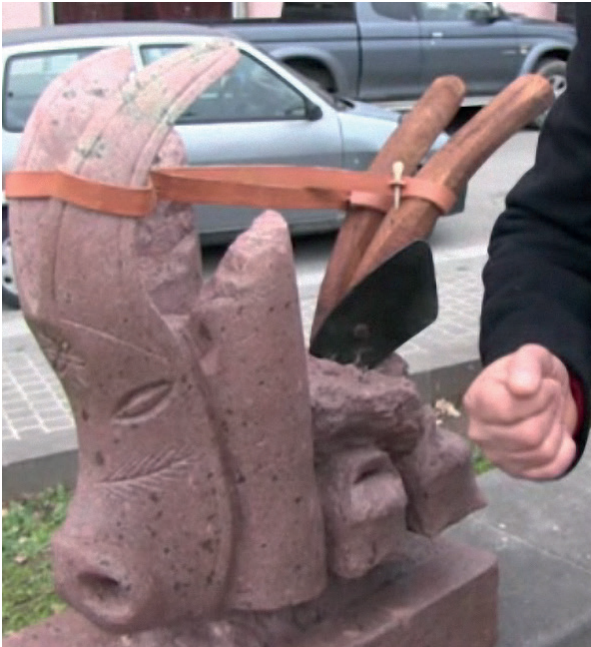
1. Escultura de piedra “boe e industria”, imagen congelada del video “Simposio scultura” (2013), Autor anónimo, Fondos de la Biblioteca Pública de Ottana.

Con la máscara he querido representar la identidad y la cultura. Tenemos estas dos torres un poco en decadencia que representan la fábrica de Ottana. [...] Mientras, aquí detrás hay un arado, que simboliza volver a la tierra y la tierra que vuelve a vivir con los cencerros. Tenemos que retornar a la tierra. Lo que nos han quitado. Porque la fábrica duró cuarenta años, poco más. La tierra nos ha dado para vivir durante miles de años y entonces el concepto es [...] que a la tierra volvemos inevitablemente. (Anónimo, 3 de febrero de 2013; traducción del autor).