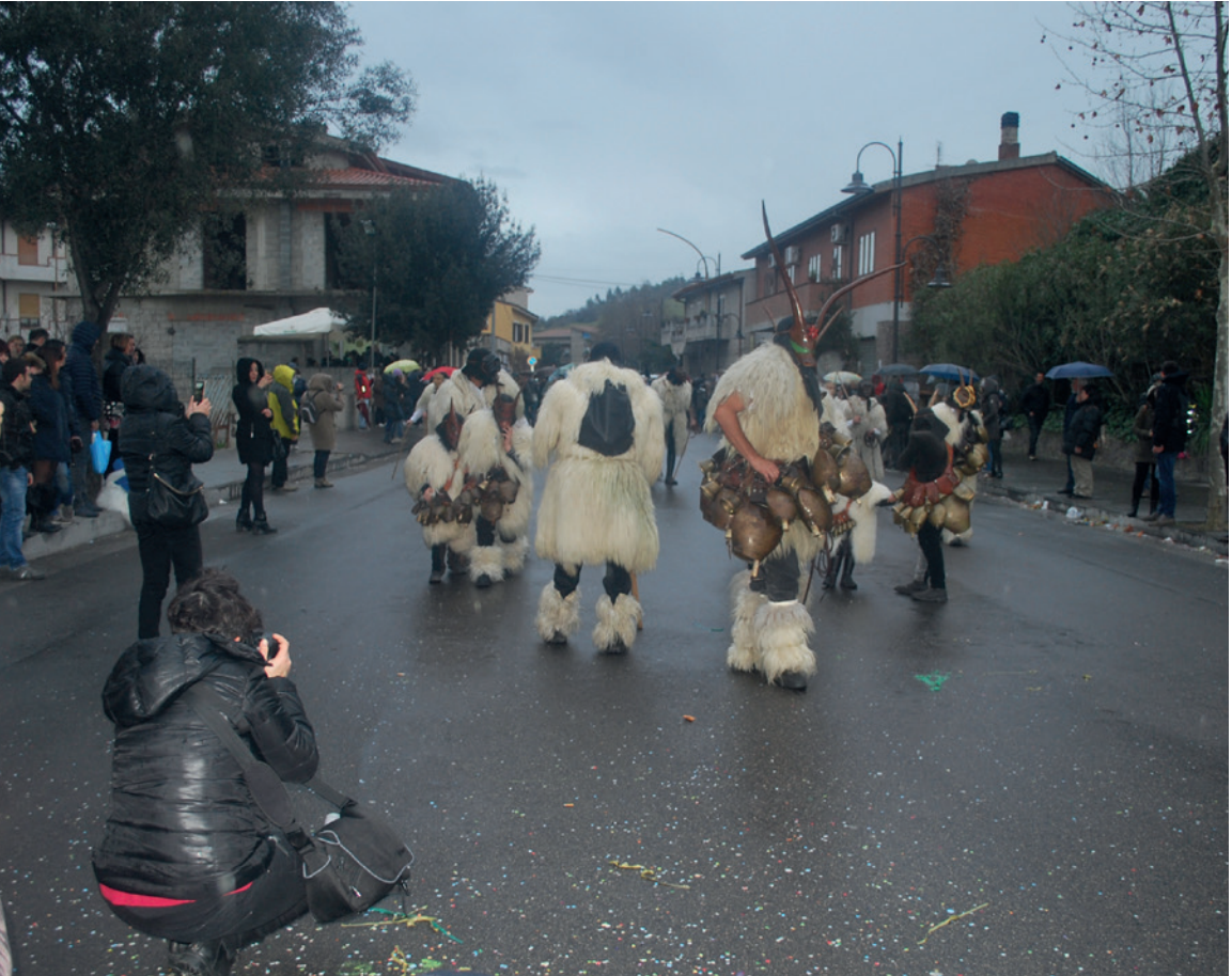
2. Desfile de “boes e merdules”. 7 de febrero de 2016.

Observando este proceso de “espectacularización” y los precedentes testimonios, es inevitable darse cuenta de las conexiones entre las “necesidades identitarias” locales y las “lógicas del patrimonio”, ampliamente profundizadas en Antropología (González Alcantud, 2003 y 2012; Palumbo, 2003 y 2006). En el estudio desarrollado en Ottana se ha hecho evidente, de facto, la puesta en práctica de un peculiar uso simbólico del carnaval capaz de dar un sentido nuevo a la comunidad: el de poderse “liberar” del pasado industrial. Se trata, por tanto, de un proceso de “objetivación cultural” (Handler, 1988) a nivel local que considera, siguiendo las razonamientos lógicos del patrimonio, todo lo relacionado con el carnaval como digno de ser considerado válido y fácilmente encomiable; es también por estas razones un extraordinario instrumento identitario de oposición a la imagen industrial. En definitiva, las jornadas del carnaval son percibidas por las instituciones locales y por las asociaciones del pueblo como una ocasión ideal para exhibir el “producto típico” y para mostrarse diferentes de lo que es el cliché.