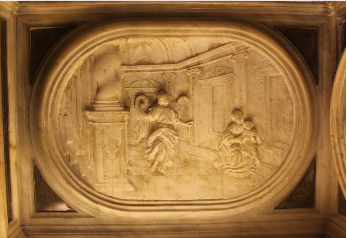
1. Familia Valero. Teofanía por medio de Ángel (Segunda mitad del Siglo XVIII) Relieve esculpido en alabastro. Camarín de Nuestra Señora del Rosario, Granada

eso representara la escena en un palacio o templo. La segunda hipótesis es simplemente que el artista cometiera un error al interpretar el episodio. Otra posibilidad es que se trate de una representación sincrética, en la que a la vez se represente la escena de la aparición del ángel y la casa de Abraham o el palacio que le corresponde a Ismael como líder de una gran nación 14 .