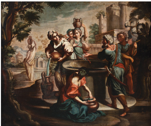
4. Anónimo Italiano. Encuentro de Rebeca y Eliezer en el pozo (Siglo XVIII). Óleo sobre lienzo. Colección privada