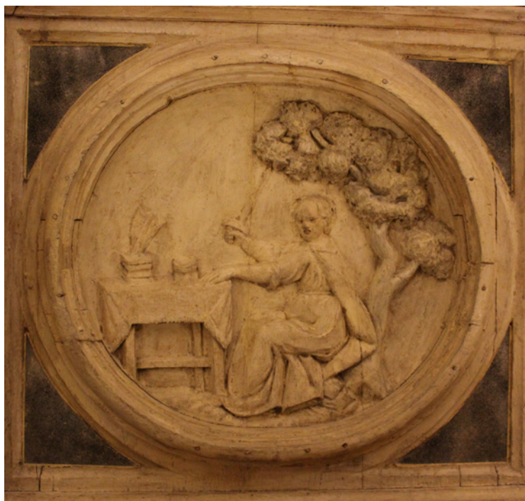
5. Familia Valero. Débora juez de Israel (Segunda mitad del Siglo XVIII). Relieve tallado en madera. Camarín de Nuestra Señora del Rosario, Granada

En algunas ocasiones se representa de pie, pero vemos como en este caso la representación es similar a la que lleva a cabo Chavarito en el Antecamarín de Lepanto. En el relieve porta los siguientes atributos: la espada de la justicia, símbolo de su condición de jueza, pero también haciendo alusión a su papel de líder militar; la mesa con libros y útiles de escritura, ya que era una gran poetisa; y por último un árbol. Uno de sus atributos iconográficos más característicos es la palmera de Efraín a la que pusieron por nombre Débora, ya que bajo su sombra se sentaba siempre la jueza para impartir justicia. Desconocemos el motivo por el que se representa bajo otro tipo de árbol distinto a la palmera, quizás por falta de espacio o por error.