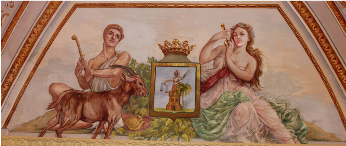
7. La Palma .

surmontado del arcángel san Miguel en su color, llevando una lanza en una mano y un escudo en la otra. Bordura de oro. El escudo es el concedido por la Reina doña Juana de Castilla mediante Real Cédula de 23 de marzo de 1510. Se muestra claramente la representación de El Teide, máxima representación geográfica de las islas, así como el santo bajo cuya advocación se conquistó la isla. A la derecha del escudo la representación femenina de la isla se apoya en el mismo, mientras sostiene en su mano una hoz dorada. En torno a ella variadas flores y frutos, en señal de la abundancia y fertilidad de sus campos. A la izquierda un putto alado vuela en un carro tirado por dragones. En su mano derecha sostiene una antorcha, la luz, el conocimiento, en representación de las instituciones académicas de la isla; la única que contaba, en esos momentos, con Enseñanza Secundaria y Universidad. Con la derecha sostiene las riendas. Los dragones se relacionan con el mito del Jardín de las Hespérides, a quien la tradición ha ubicado en Tenerife, concretamente en el Valle de la Orotava 24 . Además destacan las manzanas de entre los frutos situados en el lado derecho, tal vez muestra del mismo mito clásico.