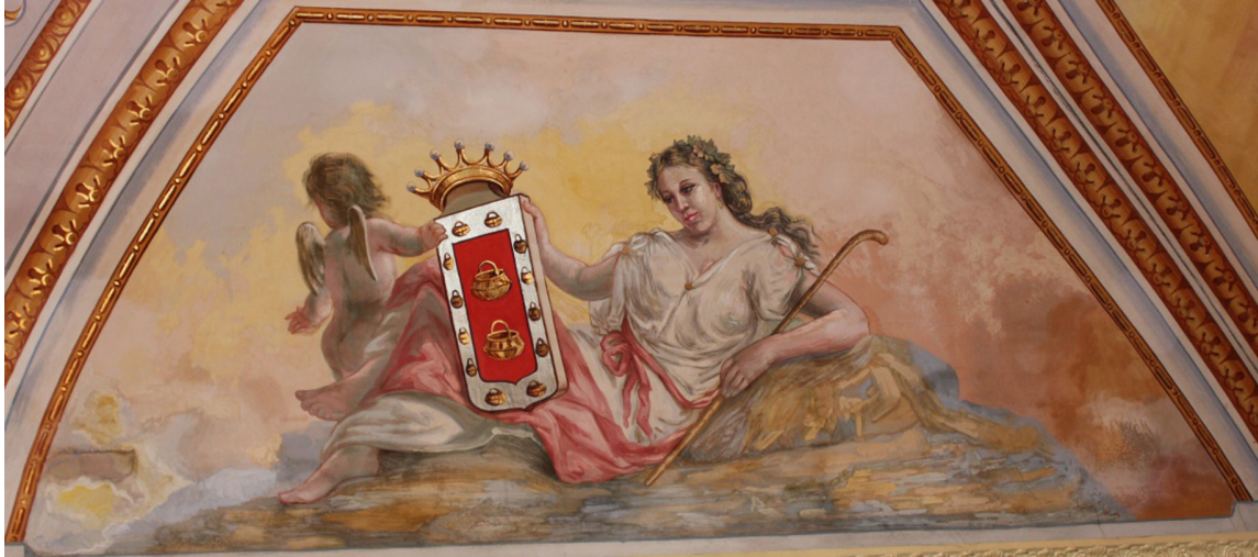
5. La Gomera .

de sinople, terrazado de lo mismo, surgiendo de un charco de plata. Adiestrado de castillo de oro y siniestrado de león de gules. Al timbre, corona condal. El árbol es el conocido «Árbol Santo o Garroé» cuyas hojas recogían la humedad y abastecían de agua a los aborígenes de El Hierro, mientras las armas de Castilla y León la vinculan al reino 20 . La corona condal la enlaza a los Condes de La Gomera, señores también de la isla de El Hierro.