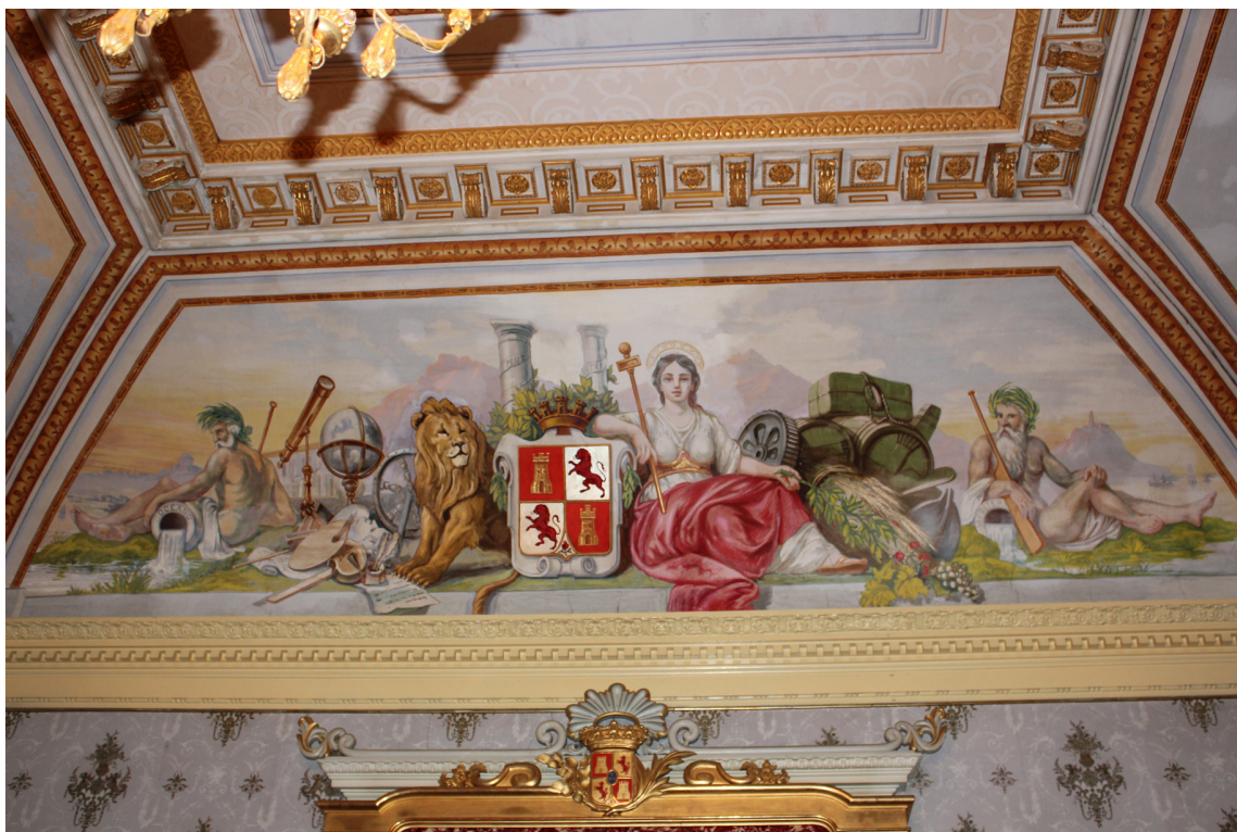
3. La Nación . Foto Museo Militar de Almeida.

Este escudo se encuentra custodiado a ambos lados por un león, símbolo de la fuerza y el poder del reino, a la izquierda, y una doncella sentada de traje blanco y manto rojo sobre sus piernas a la derecha, personificación del mismo reino; la cual porta en su brazo derecho un cetro, símbolo de la potestad de la alegoría. Tras él las columnas de Hércules y el lema Plus ultra , que se incorporaron definitivamente tras la conquista de América. En los bordes del conjunto, a ambos lados, hombres sentados de largas y canosas barbas vierten agua de sus cántaros. En la boca del cántaro de la izquierda puede leerse «OCEANO», y en el de la derecha «MEDITERR», siendo la representación