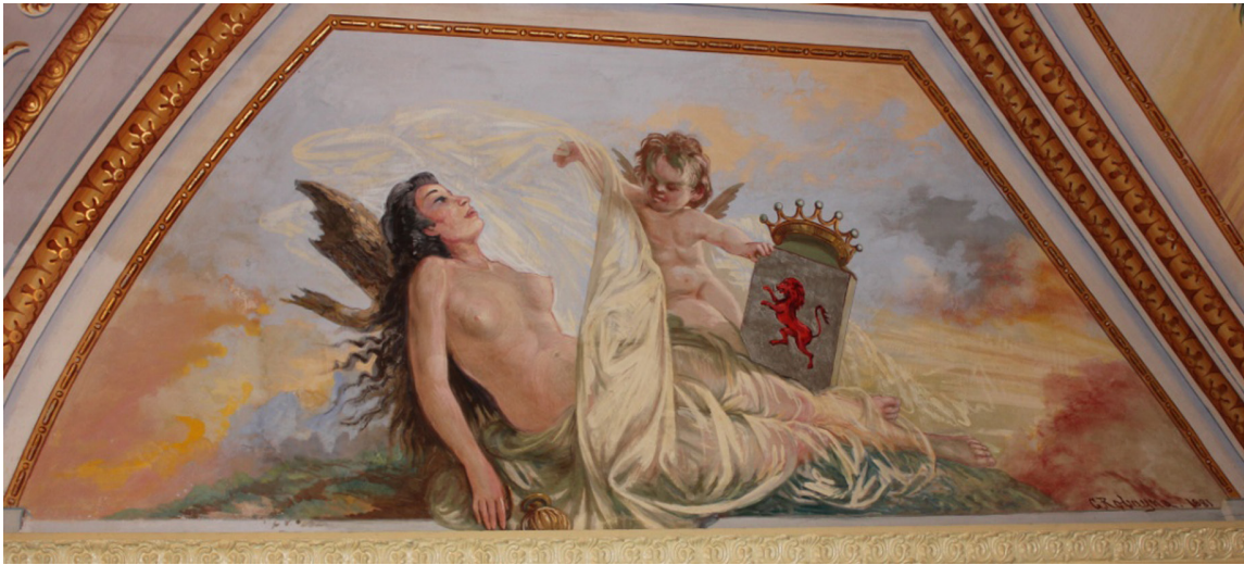
6. Fuerteventura . Foto Museo Militar de Almeida.

de Castilla. Este fue señor de las islas de Lanzarote, Fuerteventura y El Hierro. En Fuerteventura fundó la primera ciudad europea, Betancuria. Es esta composición pictórica, a su vez, la representación de la incorporación del Archipiélago al reino hispano y de la unión de las dos razas, canaria-europea tras la conquista, lo que se subraya con la actitud de la mujer, despojada de su ropa por un putto , personificación de la raza-Islas Canarias; idea tan en boga en estos momentos en el Archipiélago 21 .