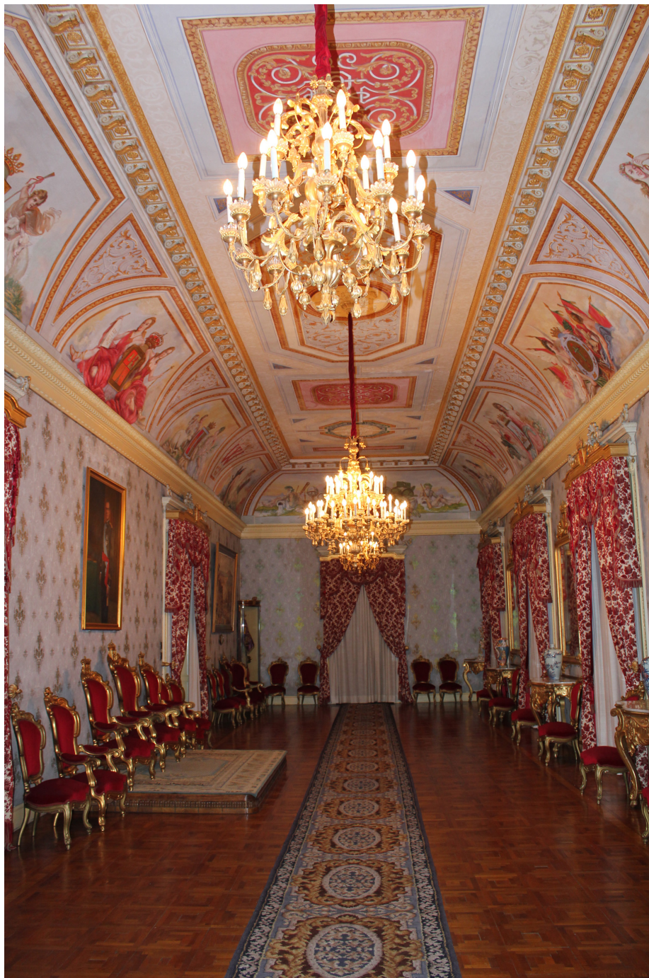
1. Interior del Salón del Trono.