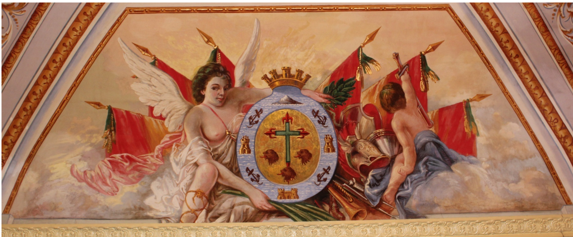
8. Santa Cruz de Tenerife .

El escudo se encuentra sujeto a la izquierda por una joven alada y vestida de túnica que deja ver su pecho, tal vez un símbolo más de la fertilidad y riqueza de la capital. Otro personaje se encuentra a la derecha, dándonos la espalda y que sostiene una espada en su mano derecha. Mira hacia las banderas que, saliendo de detrás del escudo se reparten tres y tres a ambos lados. La fémica de la izquierda sostiene en sus manos la palma que hacen referencia a la victoria en las batallas citadas. Mientras el de la derecha se circunda de alusiones a la guerra: coraza, casco, bayonetas y arcabuz.