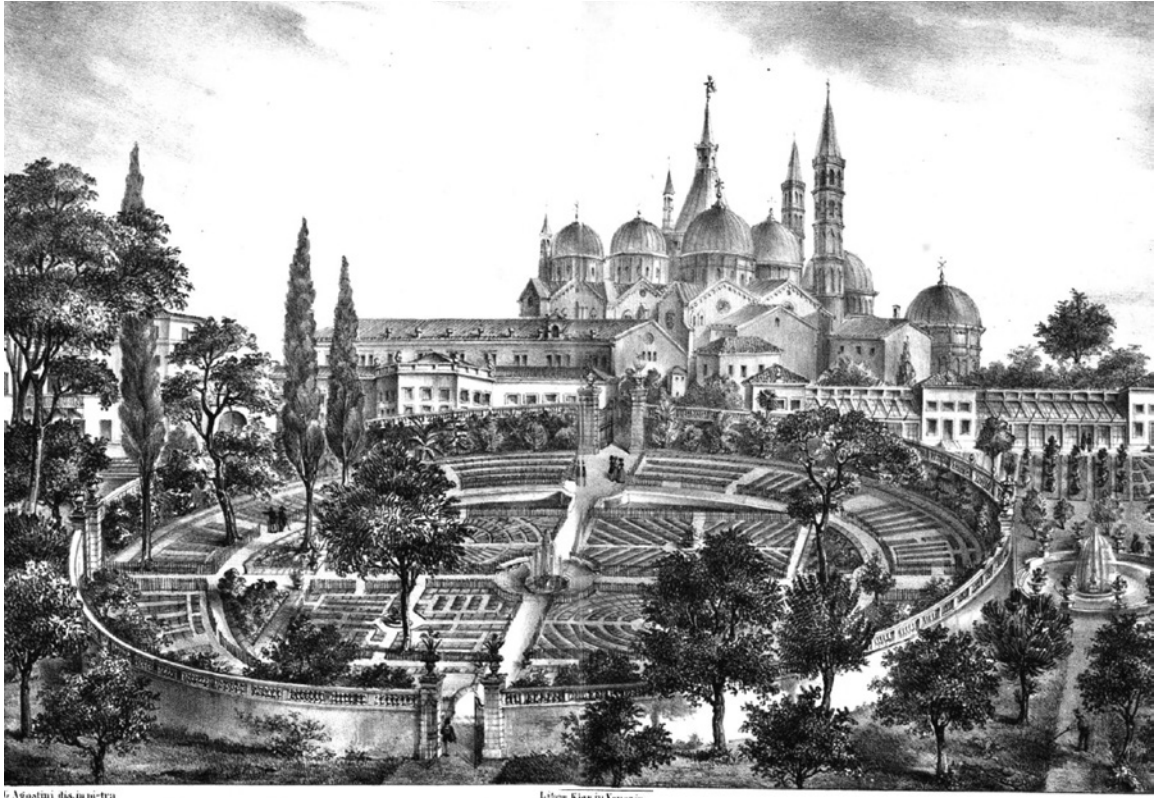
1. Litografía. El Jardín botánico de Padua. s. XVII

Estas colecciones amplían sus objetivos teniendo como referente más importante al Museo Ashmolean, asociado a la universidad de Oxford. Este es el primer museo reconocido por la mayoría de los autores “el Ashmolean nació cuando el rico y anticuario Elías Ashmole regaló su colección a la Universidad en 1682. Lo hizo -porque el conocimiento de la naturaleza es muy necesario para la vida y la salud humanas-. Se inauguró como el primer museo público de Gran Bretaña y el primer museo universitario del mundo” 6 . En este museo se custodiaban ricas colecciones de ciencias naturales, antigüedades y etnografía, estaba abierto al público de manera reglada y su organización constituyó un modelo para los museos universitarios. Su estructura contaba con un complejo arquitectónico, organizativo y funcional coherente en el que confluían un repositorio de materiales raros, un instituto de investigación y una academia educativa. Interesante es que durante doscientos años la dirección de las cátedras académicas la ostentaba un profesor y la relación del museo y la universidad era muy estrecha. Hoy se reconoce que la mayor contribución del Museo Ashmolean es institucionalizar la triple