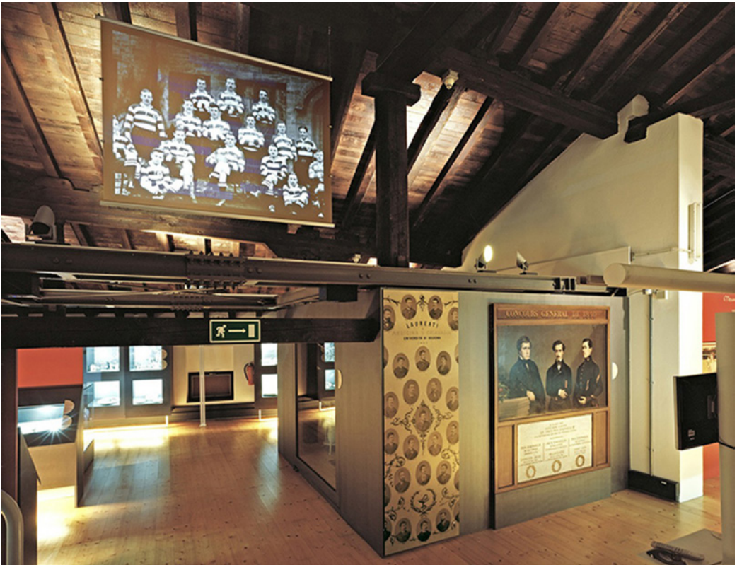
4. Museo Europeo de Estudiante, Universidad de Bolonia.

Los museos más recientes de este tipo son, por un lado, el Museo Académico de la Universidad e Coimbra creado con el objetivo de recoger y difundir el legado de la Universidad. Este museo alberga una vasta colección de materiales y objetos que documentan los aspectos más variados de la historia y vida académica y en el que en su gestión se encuentran implicadas asociaciones de exalumnos. Y por otro, el Museo del Estudiante ( Museo Europeo degli Studenti MEUS ) 16 de la Universidad de Bolonia inaugurado en el año 2000 que contiene numerosos materiales diversos que documentan la vida de los estudiantes durante ocho siglos, abarcando lo relativo a asociaciones, movimientos de protesta, tradiciones sociales, institucionales -incluyendo las festivas-; y también son la muestra de la transformación social y la educación universitaria. Una selección significativa de 400 objetos y documentos divididos en cinco secciones se exponen en sus salas. (Fig.4)