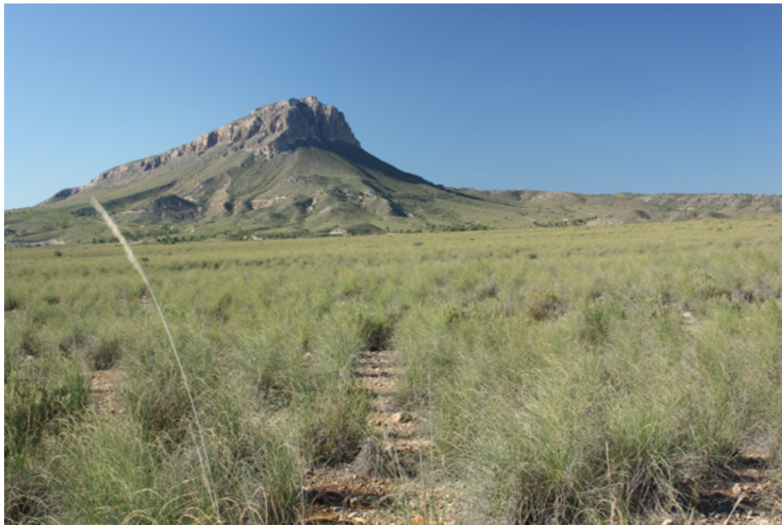
Ilustración 6. Paraje de la Cabeza del Asno, Cieza.

divisan desde esta v.[villa] son La Atalaya y el Castillo á la parte opuesta del r.[río] la del Oro, vulgarmente Lloro, á la espalda de la primera: Picarcho, Picablanca, Pila, Ascoy y Cabeza del Asno, descollando entre todas el Peñón de Armochón que se descubre á larga distancia [...]" (Madoz, 1847:388).