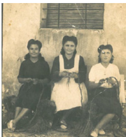
Ilustración 2. Mujeres haciendo lía.

Atendiendo a los modos de producción, el esparto se trabaja siguiendo un proceso prácticamente inmutable hasta mediados del pasado siglo. Básicamente, podríamos hablar de un trabajo en crudo , y de un esparto cocido , según el fin al que estuviera destinado. Todo comienza en el monte, donde los arrancaores recolectan el esparto valiéndose del palillo , una vara de unos 20 ó 30 cm de madera o hierro, sobre la que se giran las hojas para facilitar su extracción. Luego, los haces de esparto son tendidos en zonas aireadas y soleadas, donde se mantienen entre veinte y treinta días dorándose al sol. Una vez seco, el esparto puede trabajarse en crudo , como sucedía con la mayor parte de los productos artesanales, o entrar en una fase de separación y extracción de las fibras, utilizadas sobre todo en hilaturas y tejidos.