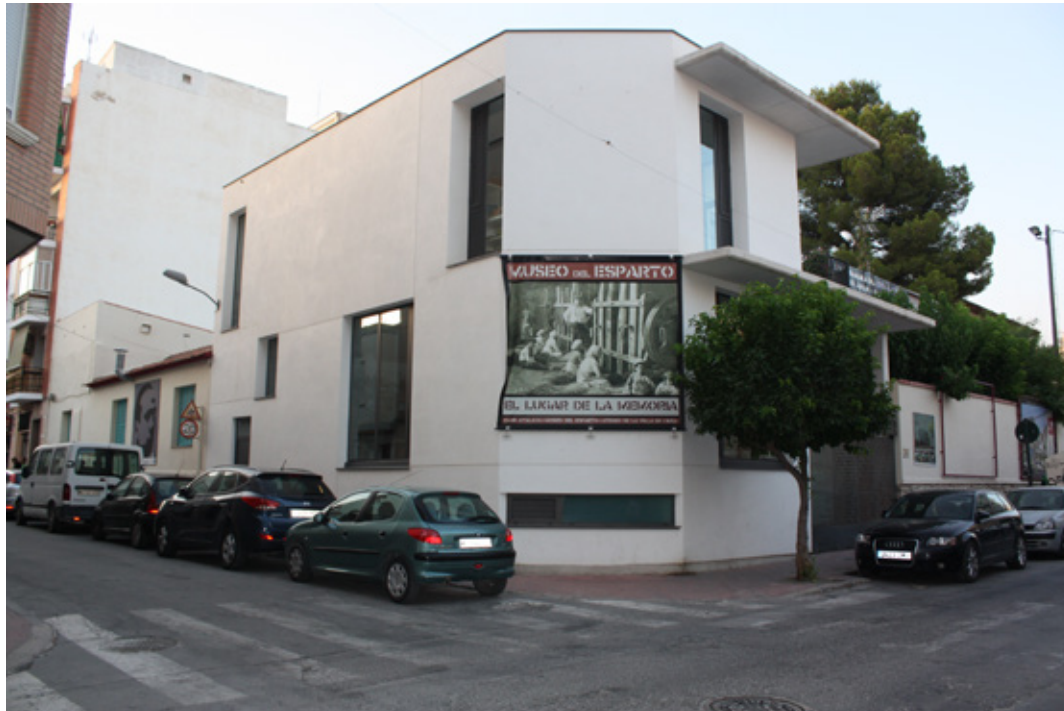
Ilustración 9. Museo-Centro de Interpretación del Esparto de Cieza.

En 2014, una subvención del Plan Territorial de Desarrollo Rural, Campoder (Iniciativa Comunitaria Leader 2009-2011) permitió la construcción del actual Museo-Centro de Interpretación del Esparto. El nuevo edificio, levantado dentro del mismo recinto de la Asociación, cuenta con 267 m 2 distribuidos en tres plantas. La planta principal se destina íntegramente a exposición, mientras que la superior acoge parte de la exposición y un espacio de biblioteca y sala de reuniones. La planta sótano, por su parte, se dedica a depósito y almacén de objetos. A todo ello se suma, en el patio, unos 100 m 2 vallados y cubiertos que cobijan diversa maquinaria industrial de gran tamaño, toda ella restaurada y en perfecto funcionamiento.