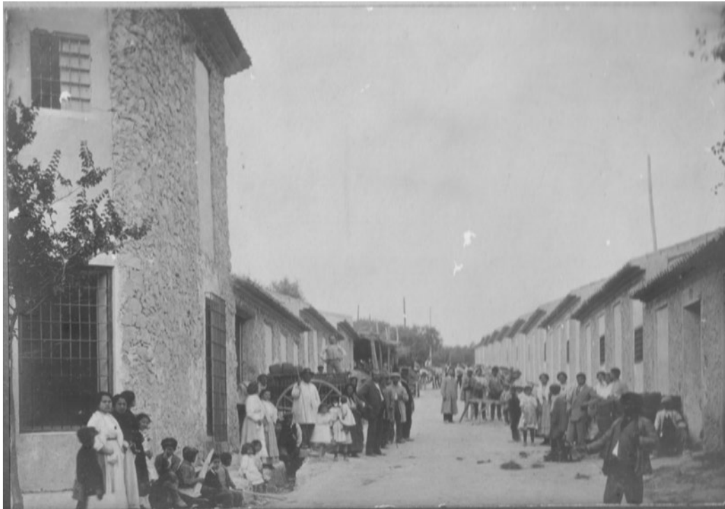
Ilustración 7. Calle Santiago, Cieza. Obreros de la fábrica de esparto de D. Silvestre Precioso.

“...el conjunto de los bienes muebles, inmuebles y sistemas de sociabilidad relacionados con la cultura del trabajo que han sido generados por las actividades de extracción, de transformación, de transporte, de distribución y gestión generadas por el sistema económico surgido de la ‘revolución industrial’. Estos bienes se deben entender como un todo integral compuesto por el paisaje en el que se insertan, las relaciones industriales en que se estructuran, las arquitecturas que los caracteriza, las técnicas utilizadas en sus procedimientos, los archivos generados durante su actividad y sus prácticas de carácter simbólico” (IPCE, 2011b:9).