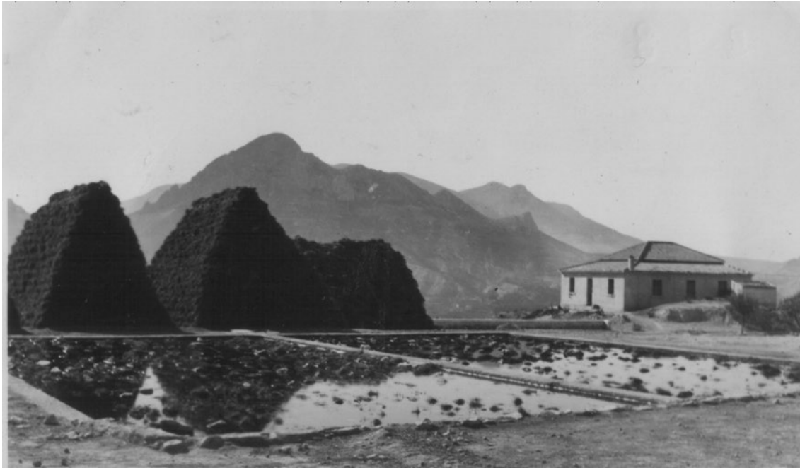
Ilustración 4. Balsas de esparto en el paraje del Toleillo.

Cartagena, diría : “...Se hace aquí una gran cantidad de cuerdas y de cables de esparto, algunos están hilados como los de cáñamo, otros no están hechos más que de esparto aplastado. [...] Estos cables son excelentes, porque flotan sobre la superficie del agua y no están sometidos a verse cortados por las rocas sobre los lados malsanos”. Y a continuación hace una muy acertada reflexión sobre esta fibra que, por su interés, reproducimos íntegra: