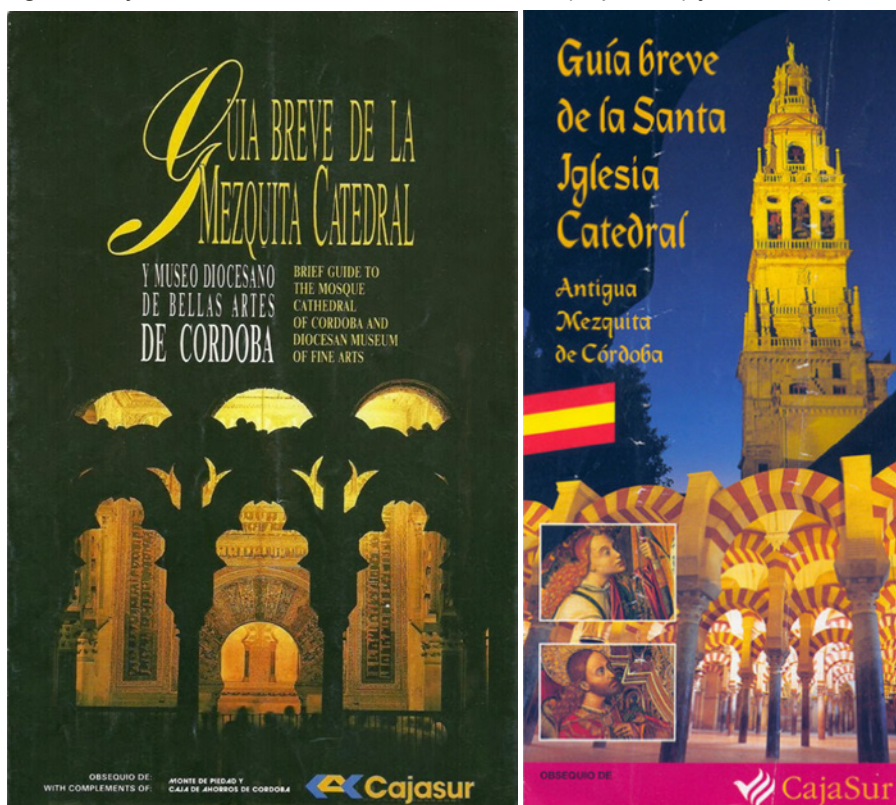
Imágenes 2 y 3. Portadas de los folletos de 1981 (izquierda) y de 1998 (derecha)