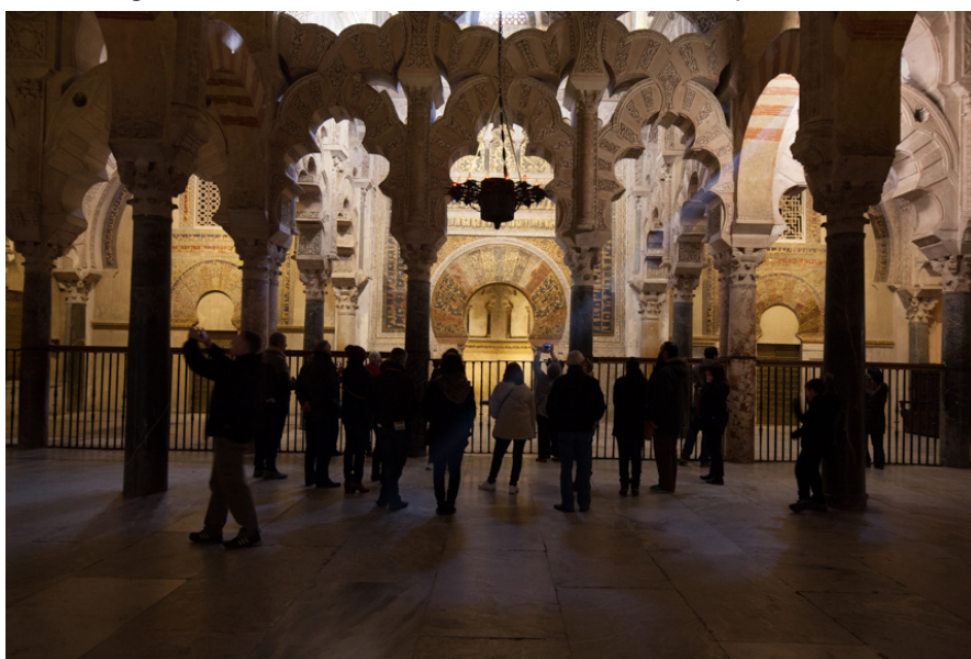
Imagen 4. Turistas en frente del mihrab de la Mezquita-Catedral