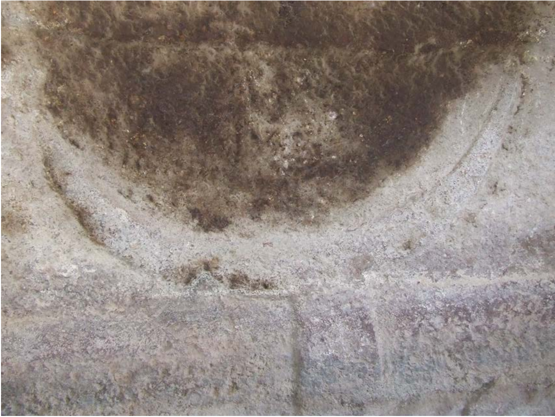
Lám. X.—Domus de la Roccia dell'Elefante (Castelsardo, Sassari)