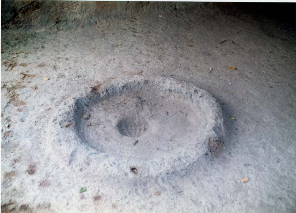
Lám. II.—Hogar con anillo perimetral de la Tumba XIII de Sant'Andrea Priu (Bonorva, Sassari)