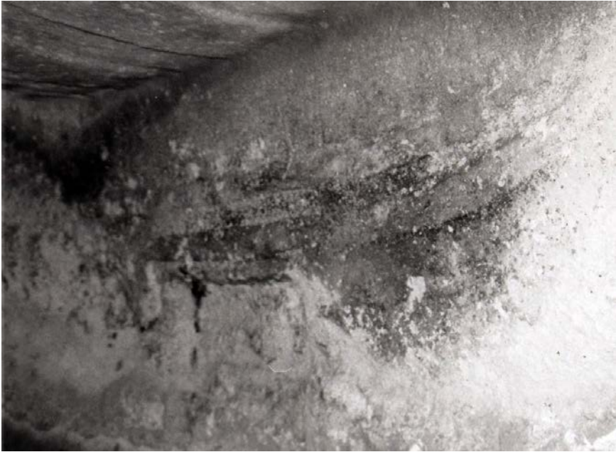
Lam. VIII.—Tumba VIII de Puttu Codinu (Villanova Monteleone, Sassari)