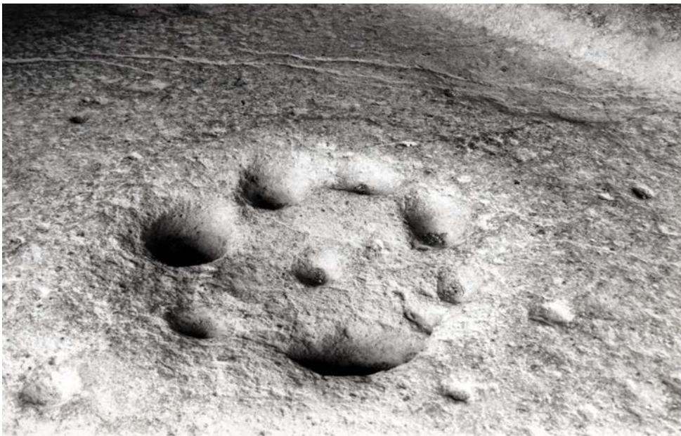
Lám. III.—Hogar de la Tumba XIII de Sant'Andrea Priu (Bonorva, Sassari)