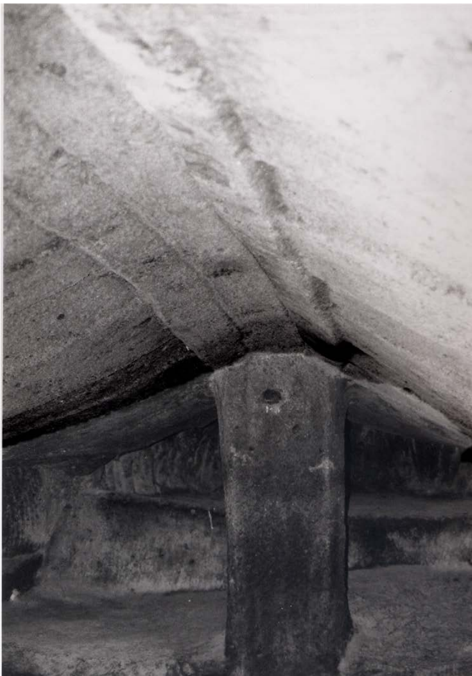
Lám. IV.—Tumba VIII de Sant'Andrea Priu (Bonorva, Sassari)