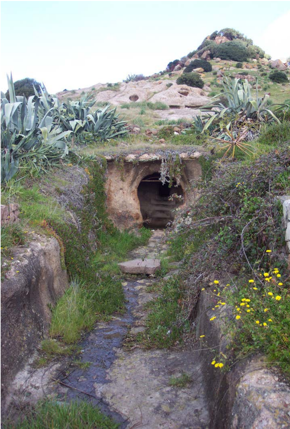
Lám. I.—Necrópolis de Santu Pedru (Alghero, Sassari)