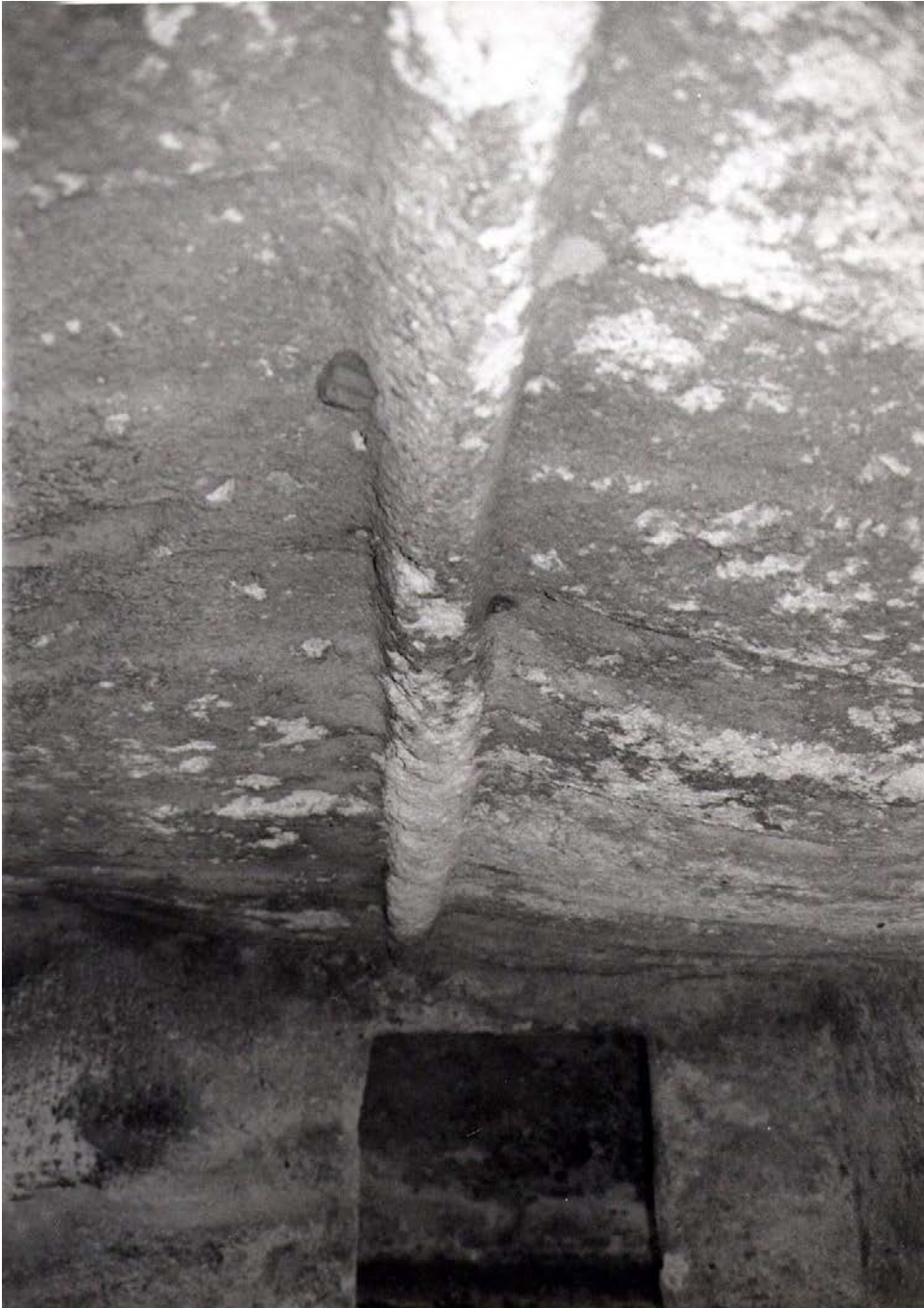
Lám. VI.—Puttu Coddinu (Villanova Monteleone, Sassari)