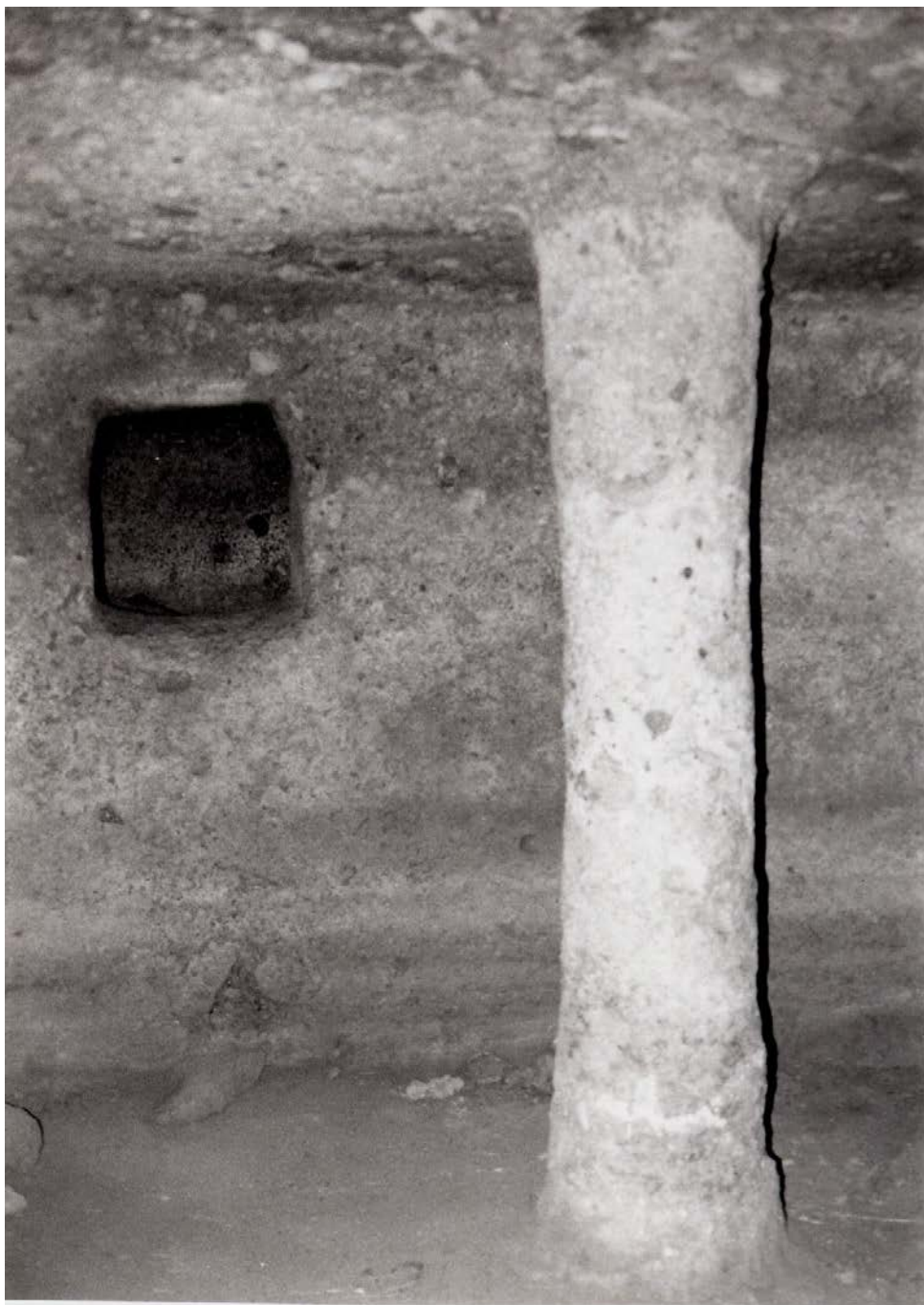
Lám. VII.—Tumba IV de Santu Pedru (Alghero, Sassari)