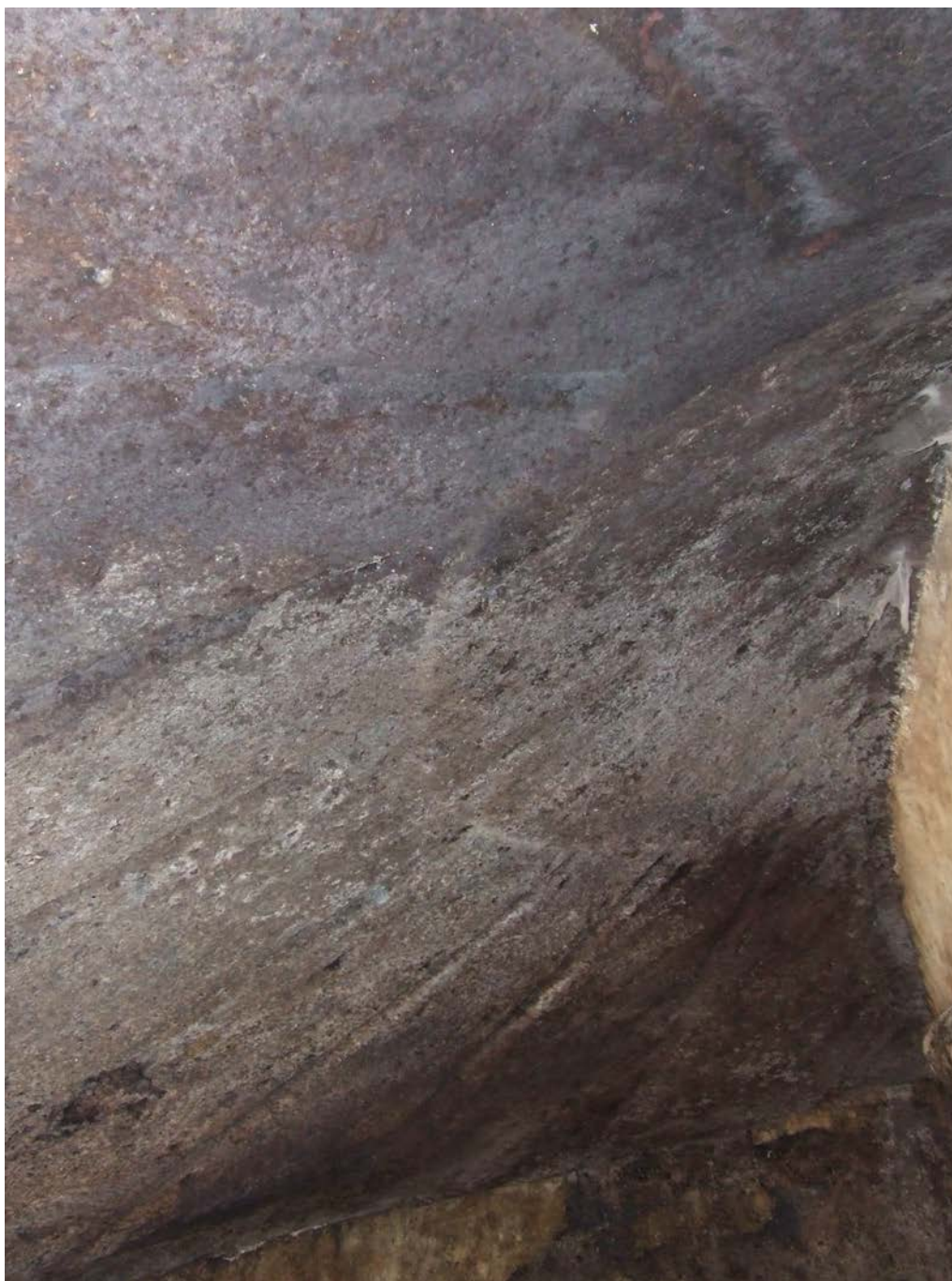
Lám. V.—Tumba VI de Sant'Andrea Priu (Bonorva, Sassari)