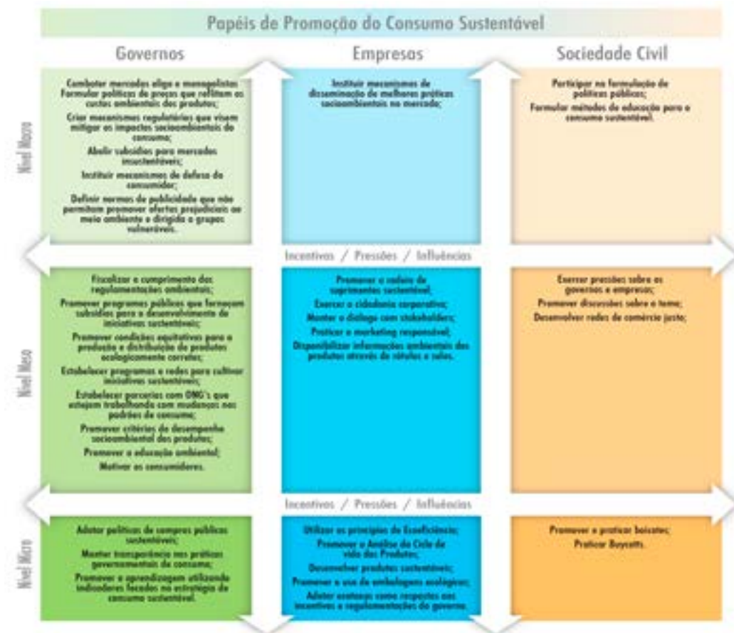
Figura 4. Framework final após aplicação do Método Policy Delphi

Os resultados foram organizados de acordo com os papéis de cada ator, em níveis macro, meso e micro, com a finalidade de apresentar um framework que representasse a opinião dos especialistas sobre os papéis dos governos, das empresas e da sociedade civil para promover o consumo sustentável no contexto brasileiro. Vale ressaltar que 35 (trinta e cinco) papéis foram apontados como relevantes e 03 (três) não foram considerados importantes. O framework final apresentado é flexível e possibilita adaptações para temas e setores específicos de consumo no contexto brasileiro. O resultado final dos papéis avaliados é apresentado na Figura 4.