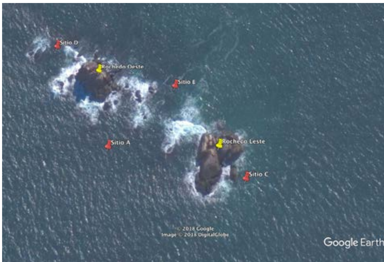
Figura 2. Imagem dos rochedos oeste e leste com os sítios de coleta na Ilha de Itacolomi.