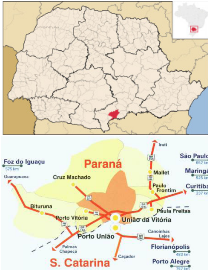
Figura 1 - Localização do município de União da Vitória na região sul do estado do Paraná, sul do Brasil e da área de estudos - representado pelo símbolo ● - dentro do município