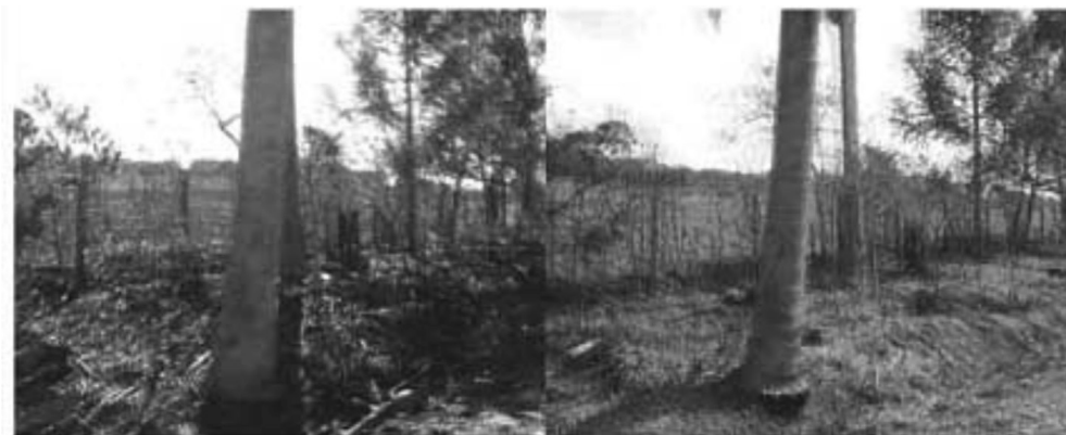
Figura 5. Anaglifos multitemporais durante e após o incêndio