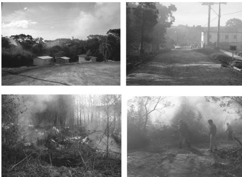
Figura 1. Fotografias individuais mostrando quatro situações na ocorrência do incêndio

galhos) [8]. A alta quantidade de fumaça produzida dificultou o tráfego de carros e pedestres no Campus , colocando em risco a segurança destas imediações (Figura 1).