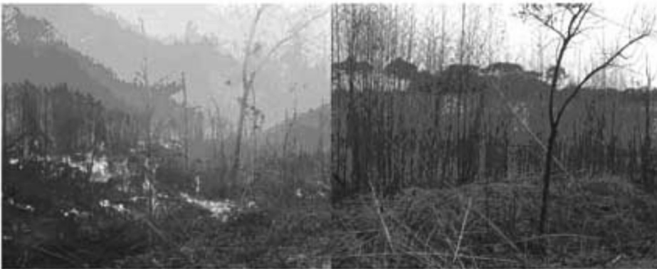
Figura 4. Fotografias multitemporais ilustrando o momento do incêndio de superfície e o local após dois meses

A figura 4 mostra o momento do incêndio de superfície num local do campus e a situação dois meses após.