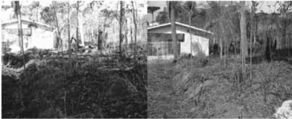
Figura 3. Fotografias multitemporais (18 de junho e 17 de agosto de 2008) mostrando o impacto do incêndio sobre o solo

(Figura 3, foto da direita), parafraseando argumentos de Heringer e Jacques [12] e Martins et al. [13].