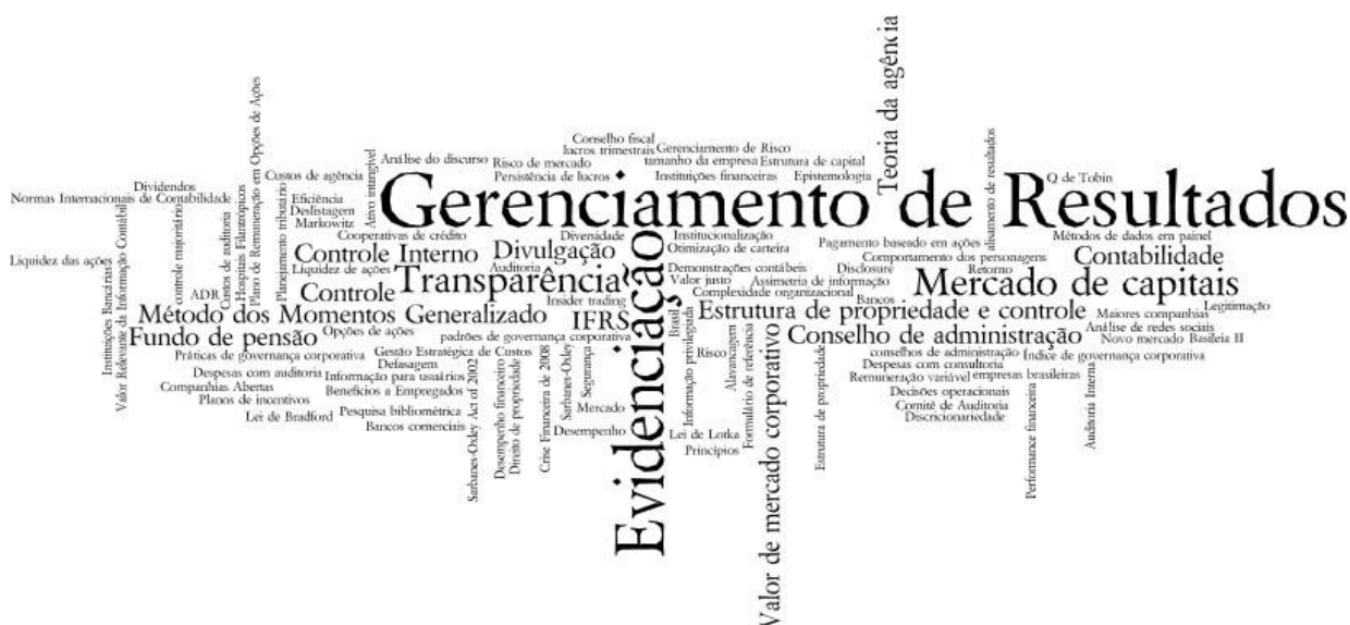
Figura 2: nuvem de palavras-chave vinculadas ao tema ‘governança corporativa’

palavras-chave analisadas, sendo maiores aquelas apresentadas com maior ocorrência nos textos dos artigos.