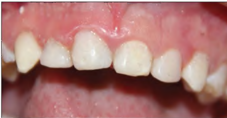
Figura N° 9: Caso terminado: dientes rehabilitados.

dientes primarios anteriores con coronas de veneer o de metal con frente estético (NuSmile) obtuvieron un éxito estético de 91 % y resistencia a fractura de 86 %, mostrando que ese tipo de restauración a pesar de atender la demanda estética del paciente, aún posee limitaciones mecánicas como la fractura, fractura precoz de la porcelana, y despigmentación de su frente estético. Así mismo, otra limitación de ese tipo de coronas fue su sellado marginal por bruñimiento en la región lingual asociado a la fractura del frente