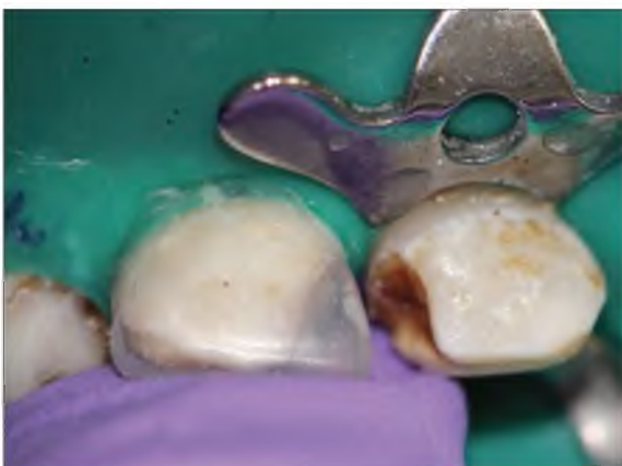
Figura N° 7: Prueba de la matriz de acetato.

de caries, desde su primera manifestación en la forma de lesión blanca, después la cavitación.