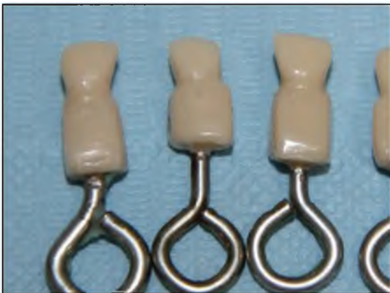
Figura N° 6: Stock de dientes de distintos tamaños.