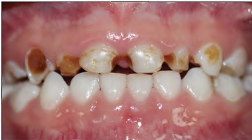
Figura N° 1: Procesos cariosos con destrucción amplia.

Paciente de sexo masculino de 5 años y 3 meses de edad, acude a la Clínica de la Segunda Especialidad de Odontopediatría de la Universidad Continental, presentando lesiones cariosas amplias en el sector anterosuperior (Figura N° 1), siendo objeto de burlas por parte de sus compañeros de clases, logrando la pérdida de la autoestima del niño y generando