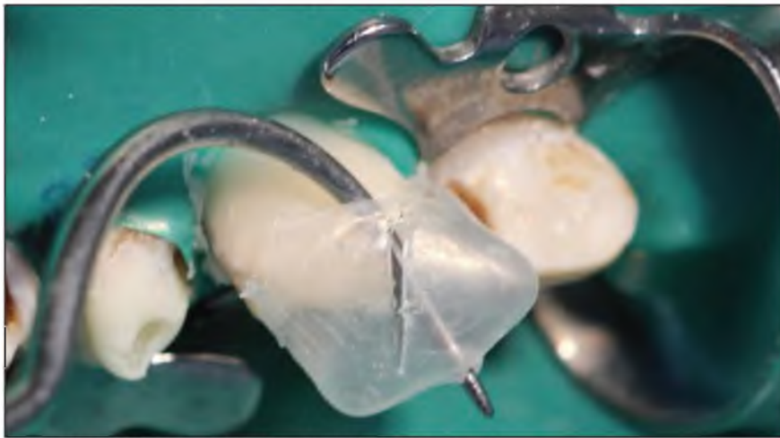
Figura N° 8: Retiro de matriz después de fotopolimerización.

En el tratamiento de lesiones extensas en incisivos temporales con composite, mediante la utilización de preformas de acetato transparentes y removibles como matriz, el procedimiento se inicia con la selección del tamaño mesiodistal adecuado de la corona de acetato