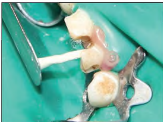
Figura N° 4: Obturación del conducto.

Después de realizar la obturación de los conductos (Figura N° 5), se procede a la colocación del espigo muñón confeccionado de acrílico en la pieza dentaria 52, debido a que presentaba una destrucción mayor a los tres cuartos de la porción coronaria que las demás piezas, y por último se coloca una base de ionómero de vidrio antes de la preparación de las coronas con la matriz de acetato.