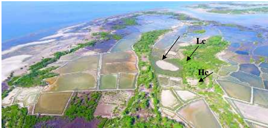
Gambar 4. Foto udara sebaran mangrove asosiasi di Desa Balandatu. S= Salicornia sp., Lc= Lansea coromandelica , Hc= Heteropogon contortus . (Foto: Muh. Teguh Nagir, 2016)

Pola penyebaran biji mangrove asosiasi juga berpengaruh terhadap pertumbuhan mangrove asosiasi secara mengelompok di daerah tersebut. Salah satunya dibantu oleh angin seperti Eupatorium odorata yang merupakan tumbuhan invasif dengan perkembangan sangat cepat dan membentuk komunitas yang rapat sehingga dapat menghalangi perkembangan tumbuhan lain. Hal ini menyebabkan Eupatorium odorata mampu mendominasi daerah tertentu di kawasan mangrove asosiasi dengan membentuk rumpun.