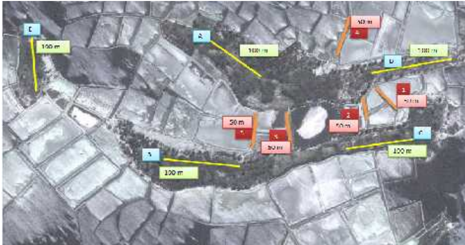
Gambar 3: Pembagian stasiun dan transek sampling mangrove asosiasi di Desa Balandatu

Pengambilan data pada daerah non tambak dilakukan menggunakan transek sepanjang 100 m dengan 5 plot berukuran 10 x 10 m pada beberapa titik di daerah yang masih ditumbuhi oleh mangrove asosiasi. Kemudian dalam plot 10 x 10 m dibentuk plot “ nested kuadrat ” untuk memudahkan perhitungan sampel mangrove asosiasi dengan beberapa kategori yaitu, herba, anakan, semak, perdu dan pohon. Sebagian besar kawasan yang dulunya menjadi habitat bagi mangrove asosiasi, kini telah berubah menjadi area tambak yang luas.