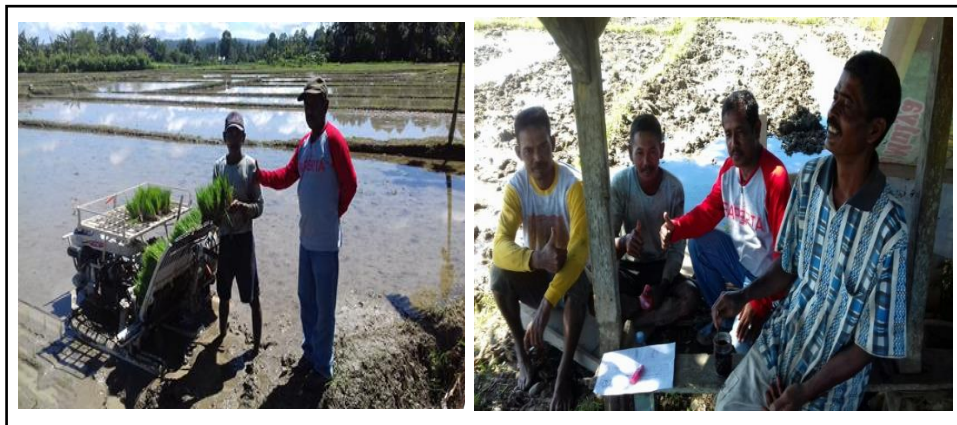
Gambar 3. Tahapan Penanaman Padi (Kiri) dan Diskusi dengan petani (Kanan).