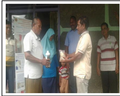
Gambar 2. Penyerahan Produk Pupuk kepada Petani

Pendampingan kepada petani juga dilakukan selama dalam tahapan penanaman sampai produksi tanaman pada demplot dalam bentuk diskusi dengan petani untuk mengevaluasi pelaksanaan demplot dan mengidentifikasi permasalahan yang timbul (Gambar 3).