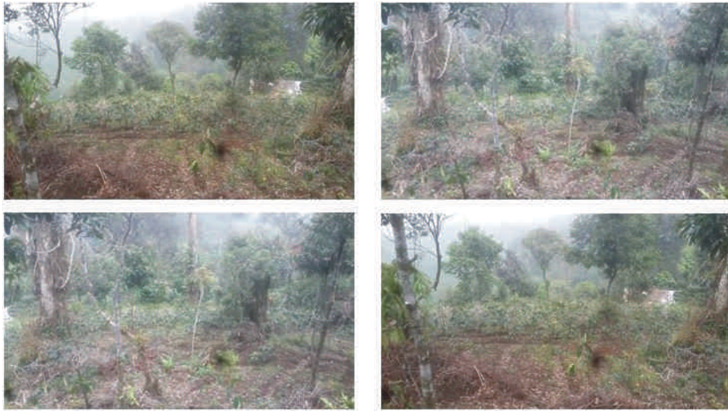
Gambar 2. Kopi Robusta dan Arabika yang ditanam pada kawasan HPD Puncak Lestari pada ketinggian 1.400 meter di atas permukaan laut

melakukan penebangan pohon yang termasuk ke dalam jenis pohon kelas perusahaan seperti pohon pinus dan damar. KPH Bogor juga bertugas untuk menunjukkan kepada para penggarap lahan mengenai lokasi-lokasi mana saja yang diperbolehkan untuk dilakukan kegiatan penanaman kopi dan lokasi-lokasi mana saja yang memang tidak diperbolehkan untuk dilakukan kegiatan penanaman.