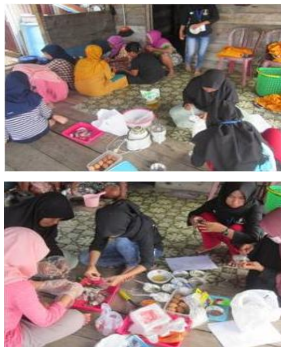
Gambar 3 Proses pemberdayaan dan pembelajaran olahan makanan berbahan dasar ikan.

interaksi antara mahasiswa KKN dan tim dosen pengabdian UHO dengan kelompok sasaran. Tim dosen memberikan penekanan kepada peluang usaha dengan adanya alternatif variasi makanan berbahan dasar ikan, yaitu abon ikan, bakso ikan, dan nugget ikan (Gambar 4). Usaha ini dapat dikombinasikan dengan wisata pancing dalam karamba tancap multifungsi. Kelompok sasaran diajarkan bagaimana melihat peluang usaha dengan adanya kawasan wisata Pulau Bokori di daerah mereka yang sudah lama berkembang. Melihat potensi sumber daya ikan masih melimpah ditambah adanya peluang pasar dengan adanya wisata Pulau Bokori, bisnis wisata kuliner dapat dijadikan alternatif pilihan wisata bagi masyarakat.