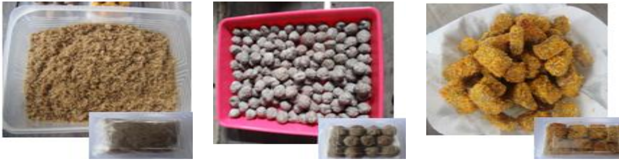
Gambar 4 Produk olahan ikan (abon, bakso, dan nugget ikan).

anak, serta variasi menu makanan keluarga. Mengonsumsi ikan sebanyak dua ons dalam sehari telah memenuhi separuh dari kebutuhan harian protein hewani (DKP 2009). Lebih lanjut, ikan juga sebagai bahan makanan yang mengandung protein tinggi dan mengandung asam amino esensial yang diperlukan oleh tubuh. Ikan adalah satu-satunya protein hewani yang memiliki kolesterol jahat yang rendah, mudah dicerna, dan mengandung mineral serta vitamin yang dibutuhkan tubuh manusia (Adawyah 2008).