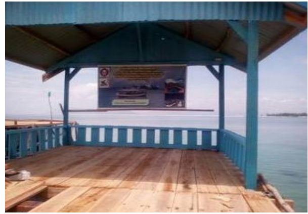
Gambar 1 Hasil demplot pembuatan karamba tancap multifungsi (karamba dengan gazebo).

Pemberdayaan dan pembelajaran kepada kelompok binaan tidak hanya sebatas pemberian contoh/demplot karamba tancap saja, akan tetapi pengetahuan seputar cara budi daya yang baik dan cara berbisnis wisata bahari juga sebagai bahan utama dalam program ini. Adapun tingkat pemahaman kelompok sasaran terhadap materi yang diberikan sangat memuaskan, yaitu di atas 90%. Responden merasa puas dan paham terhadap bimbingan teknis cara budi daya dengan menggunakan karamba tancap multifungsi (Gambar 2). Hal tersebut menjadi kekuatan tersendiri terhadap keberhasilan