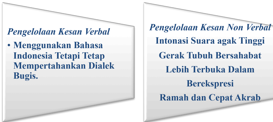
Gambar 3 : Pengelolaan Kesan Verbal

Uraian secara rinci mengenai pengkategorian hasil penelitian tersebut, dapat di lihat pada gambar 3, berikut mengenai pengelolaan kesan verbal etnik Bugis dalam berinteraksi dengan budaya Sunda, yakni :