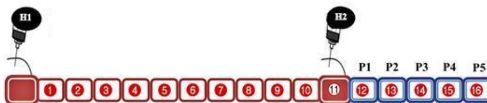
Gambar 2 Skema injeksi ganda cloprostenol secara intramuskuler. H1 adalah waktu dilakukannya injeksi pertama, H2 adalah waktu injeksi kedua. P1-P5 adalah waktu pengamatan gejala estrus