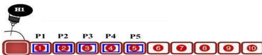
Gambar 1 Skema injeksi tunggal cloprostenol secara intramuskuler. H1 adalah waktu dilakukannya injeksi, P1-P5 adalah waktu pengamatan gejala estrus