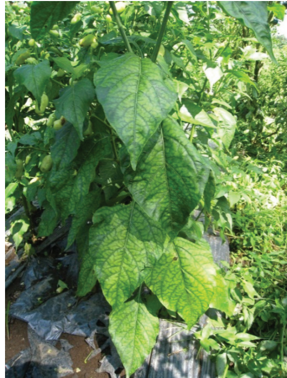
Gambar 1 Gejala klorosis pada tanaman cabai di daerah Payangan, Gianyar, Bali. Seluruh daun memperlihatkan gejala klorosis, menguning di antara tulang daun. Tulang daun dan jaringan di sekitarnya tetap hijau sehingga tampak menyirip.

Beberapa anggota famili Luteovirus telah dilaporkan menyebabkan gejala daun menguning pada tanaman cabai di beberapa belahan lain dunia. Pepper vein yellows virus (PeVYV), menyebabkan gejala menguning dan daun menggulung pada tanaman paprika, dilaporkan sejak 1981 di Okinawa, Jepang (Yonaha et al. 1995). Pepper yellow vein virus (PYVA) yang menginduksi gejala tulang daun kuning ( yellow vein ) pada cabai telah dilaporkan dari Inggris. Kedua virus, PeVYV dan PYVA, memiliki sifat berbeda dalam hal penularan dengan serangga vektor (Fletcher et al. 1987). Dua Luteovirus yang lain, Beet western yellows virus (BWYV) (Timmerman et al. 1985) dan Capsicum yellow virus (CYV) (Gunn and Pares 1990) telah diisolasi dari tanaman cabai masing-masing di Amerika dan Australia, dan keduanya memperlihatkan reaksi serologi yang berbeda dengan PeVYV. Baru-baru ini tanaman cabai di Israel dilaporkan menunjukkan gejala klorosis antartulang daun ( inter veinal chlorosis ) dan pemendekan internoda serta penurunan kualitas buah dan diketahui terinfeksi oleh anggota Polerovirus , yaitu Pepper yellow leaf curl virus (PYLCV) (Dombrovsky et al. 2010).