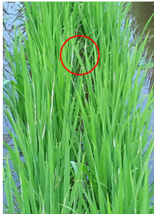
Gambar 1 Gejala penyakit pucuk putih ( white tip ) pada padi varietas IPB 3 S di lapangan.

Sebanyak 5 g benih padi varietas SL8SHS, HIPA14, IPB3S, IR-64, Pertiwi, Inpari 31, Pandan Wangi Bogor, dan Ciherang diekstraksi nematodanya berdasarkan standar ISTA (2014) yang dimodifikasi. Benih padi tersebut berasal dari kios pertanian di Bogor dan KP Muara. Benih padi 8 varietas tersebut dipotong bagian hilumnya, diletakkan di atas saringan nilon dengan diameter mata saringan 0.25 mm, kemudian diberi air hingga benih terendam, dan selanjutnya diinkubasi 24 jam pada suhu sekitar 25 °C. Setelah 24 jam, air hasil ekstraksi disaring dengan saringan 500 mesh dan disimpan dalam tabung koleksi untuk diamati menggunakan mikroskop stereo.