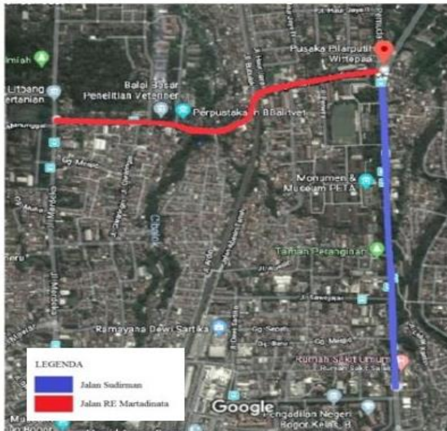
Gambar 1 Lokasi pengamatan kondisi kepadatan lalu lintas di Jalan RE Martadinata Bogor (garis warna merah).

Dispersi polutan dalam penelitian ini diduga dengan FLLS ( Finite Length Line Source ). Metode FLLS digunakan untuk menentukan konsentrasi polutan dan penyebarannya dengan membagi daerah sumber emisi menjadi segmen-segmen terkecilnya. FLLS merupakan modifikasi dari infinite length line source yang digunakan dalam perhitungan line source gaussian . Paramitadevi (2014) menggunakan model line source gaussian dengan berasumsi bahwa sebuah line source adalah sebuah deret point source yang saling tergantung dan masing-masing menghasilkan keputulan polutan.