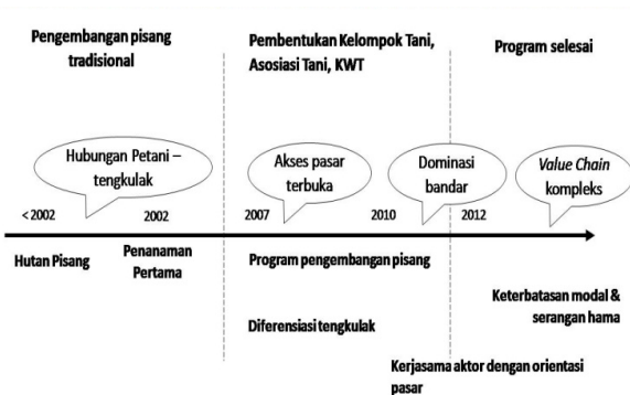
Gambar 1. Timeline Perkembangan Komoditas Pisang

pertanian melalui pengembangan agribisnis yang berkelanjutan dan juga berwawasan lingkungan. Menurutnya, persiapan ketangguhan petani dalam pembangunan pertanian bukan saja diukur dari kemampuan petani dalam mengatur usahanya sendiri, tetapi juga kemampuan dan ketangguhan petani dalam mengelola sumberdaya alam secara rasional dan efisien, berpengetahuan, terampil, cakap dalam membaca peluang pasar. Petani juga harus mampu menyesuaikan diri terhadap perubahan dunia dalam pembangunan pertanian. Oleh karena itu, wajar saja jika program ini menjadikan pisang sebagai komoditas yang dibudidayakan untuk kepentingan komersial.