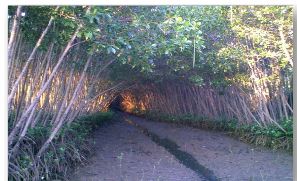
Gambar 3. Lorong di Sela Mangrove untuk Lalu Lalang Kapal

tongke adalah kelompok KPSDA-ACI (kelompok pelestarian sumber daya alam-aku cinta Indonesia). Kelompok ini dibentuk tahun 1985 pada tahap awal penanaman mangrove di Tongke-tongke Namun secara legal formal, kelompok KPSDA-ACI diresmikan baru pada tahun 1988 dengan dukungan dari instansi terkait seperti BRLKT dan Dinas Perkebunan dan Kehutanan. Kalompok ACI yang telah mendapat dukungan legal formal tersebut telah memiliki AD/ART serta memiliki struktur organisasi dengan beberapa seksi/bagian dalam kepengurusan sehari-hari (Gambar 2).