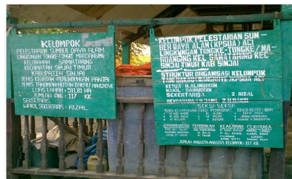
Gambar 2. Kelompok Lokal KPSDA-ACI

Salah satu lembaga lokal yang sudah establish dan banyak berperan dalam upaya pelestarian hutan mangrove di Tongke-