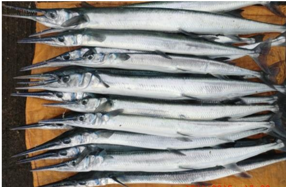
Gambar 4 Hasil tangkapan ikan cendro