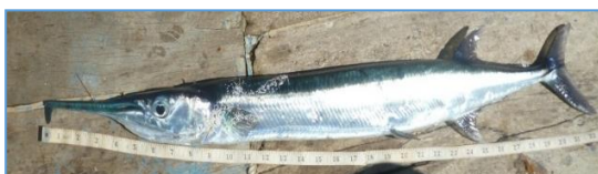
Tylosurus acus melanotus