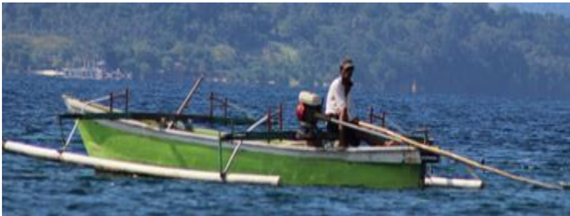
Gambar 2 Perahu tipe pelang yang digunakan

Perahu penangkap yang digunakan adalah tipe pelang empat unit dengan mesin katinting 5,5 PK; dimensi utama perahu: panjang 5,3-5,9 m, lebar 0,30-0,43 m, tinggi 0,30-0,65 m. Hasil tangkapan pancing layang-layang selama penelitian berjumlah 40 ekor ikan cendro, yang terdiri dari dua jenis yaitu Tylosurus crocodilus dan Tylosurus acus melanotus . Sebanyak 22 ekor ikan cendro tertangkap dengan umpan alami dan 18 ekor tertangkap dengan umpan buatan. Hasil tangkapan didominasi oleh ikan cendro spesies Tylosurus crocodilus sebanyak 39 ekor dan spesies Tylosurus acus melanotus hanya tertangkap 1 ekor.