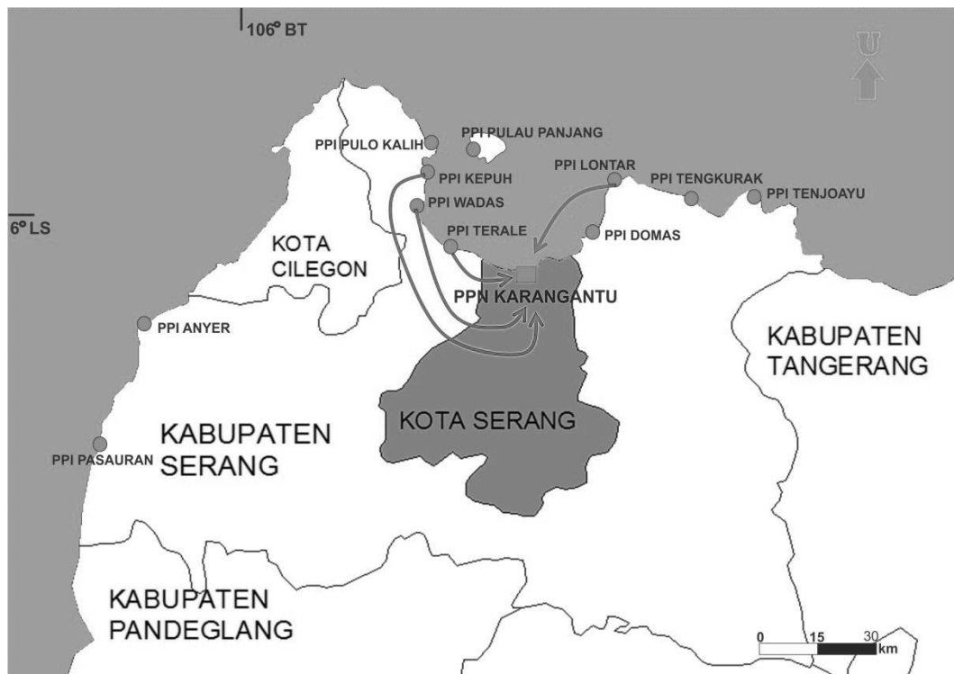
Gambar 2 Peta distribusi ikan hasil tangkapan dari PPI-PPI sekitar PPN Karangantu