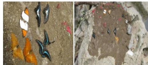
Gambar 2. Sekumpulan kupu-kupu mati di bebatuan.

Pengamatan di daerah riparian tepatnya di bagian pinggir sungai, menjumpai kupu-kupu mati pada tumpukan pasir di atas bebatuan. Di sepanjang jalur pengamatan banyak ditemukan letak tumpukan pasir dengan adanya bekas urine manusia yang terdapat bangkai kupu-kupu. Bangkai kupu-kupu tersebut terdiri dari beberapa jenis dengan jumlah sekitar 10 individu setiap tumpukan pasir. Kupu-kupu mati di bebatuan di daerah pinggiran sungai dapat dilihat pada Gambar 2.