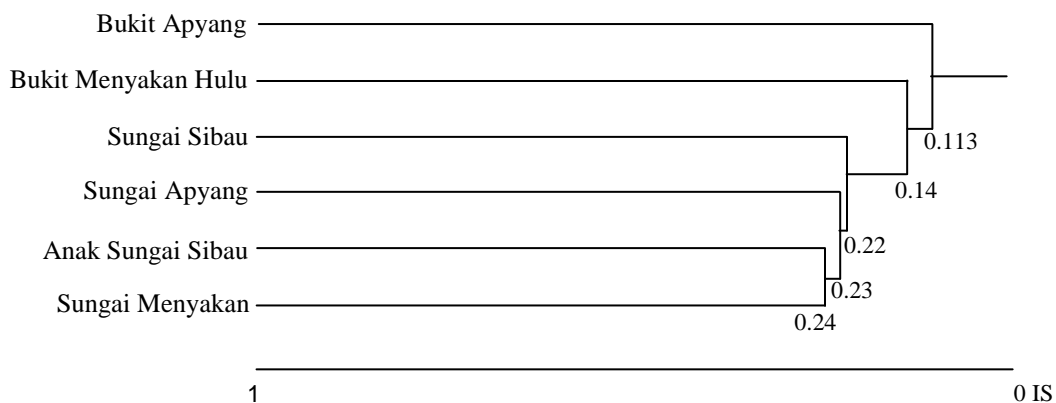
Gambar 2. Dendrogram kesamaan jenis burung antar lokasi di DAS Sibau, TNBK

Keterangan : SS = Sungai Sibau; SA = Sungai Apyang; SM = Sungai Menyakan; AS = Anak Sungai Sibau; BA = Bukit Apyang; BM = Bukit Menyakan Hulu