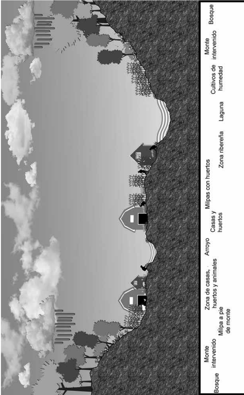
Figura 2. Transecto del paisaje hídrico: espacios reconocidos y manejados por las comunidades mazahuas