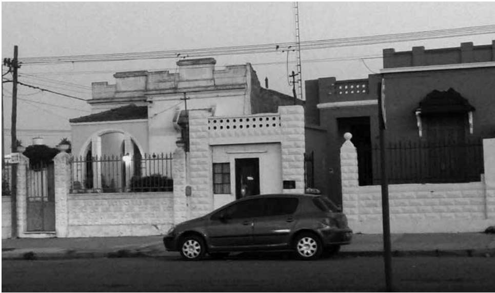
Figura 2. Viviendas del barrio de La Estación en 2014