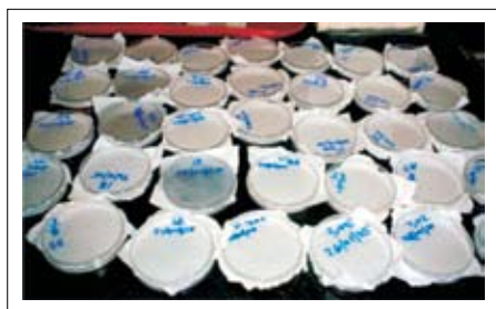
Figura 2. Arreglo de posturas de E. rufimanus en cajas Petri para determinar el tiempo de eclosión de los huevos.

tallo y hojas de maíz, sustrato que se cambió cada 18 horas. En las cajas de Petri se mantuvieron hasta el segundo estado ninfal (Figura 2).