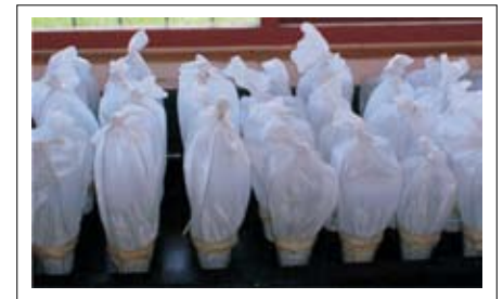
Figura 1. Materas utilizadas como unidad de cría para establecer la colonia en el estudio del ciclo de vida de E. rufimanus .

Se colectaron adultos de E. rufimanus en lotes comerciales de maíz; una primera colección de insectos (85) se tomó en el Centro Experimental Taluma de CORPOICA situado a 95 km de Puerto López y la otra captura (100) se realizó en la finca Tanane en el km 22 vía a Puerto López, las dos localidades en el Piedemonte Llanero del departamento del Meta al oriente de Colombia. Estos insectos se llevaron al Centro de Investigación La Libertad en Villavicencio (Meta) ubicado a 336 m.s.n.m. La colonia se estableció en instalaciones de casa malla en el área del Laboratorio de Entomología, con temperatura de 28 ± 2°C y 75% HR. De la colección de individuos de campo se sexaron y se tomaron 50 parejas las cuales se colocaron cada una en materas con dos plántulas de maíz de la variedad ICA V-109. Las dimensiones de la matera fueron de 10 × 12 × 14.5 cm, las cuales fueron cubiertas con tela tul para evitar el escape, generando así una colonia de laboratorio de este insecto (Figura 1).