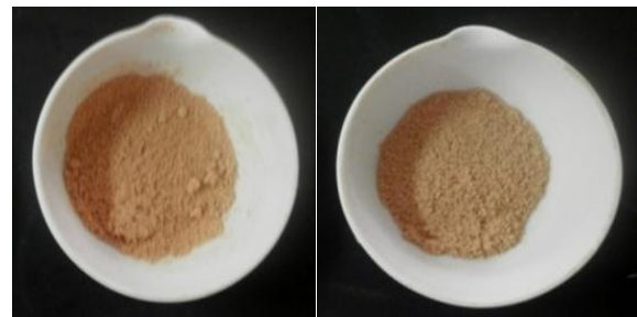
Gambar 1. Penampakan visual bubuk pewarna ekstrak biji pinang (a) perlakuan tanpa bahan pengisi (b) perlakuan penggunaan bahan pengisi gum arab

Biji pinang diekstrak menghasilkan filtrat (total padatan terlarut sebesar 2,63%) yang selanjutnya dikeringkan, baik dengan perlakuan tanpa bahan pengisi maupun dengan perlakuan menggunakan bahan pengisi gum arab sebanyak 2% dari bobot filtrat menghasilkan bubuk ekstrak biji pinang (Gambar 1) dengan karakteristik seperti yang dapat dilihat pada Tabel 2.