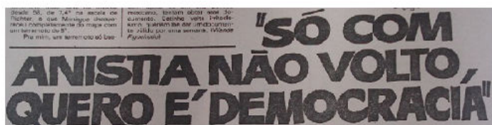
Pasquim, 08-14/06/1979, n° 519, ano 10. Apesp: AI/087PAS.