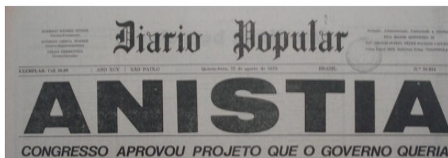
ANISTIA: congresso aprovou projeto que governo queria, Diário Popular , capa, 23 ago.1979. Apesp: 09/004.