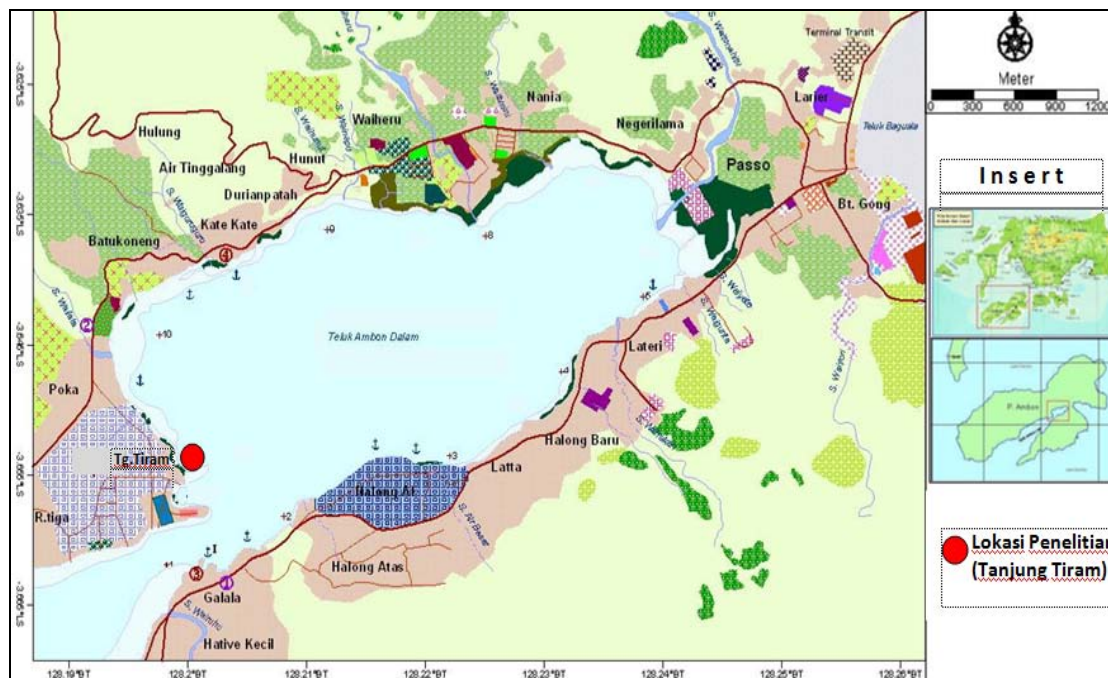
Gambar 1. Peta lokasi penelitian di perairan pantai Tanjung Tiram-TAD yang terletak pada inlet antara Teluk Ambon Dalam (TAD) dan Teluk Ambon Luar (TAL).

Dimana: K_s = Komposisi spesies ikan (%), n_i = Jumlah individu setiap spesies ikan, N = Jumlah individu seluruh spesies ikan.