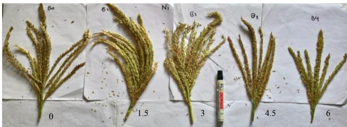
Gambar 1. Variasi morfologi tassel berdasarkan dosis boron (kg ha -1 )

Pemupukan NPK 600 kg ha -1 bersama dengan boron 3 kg ha -1 meningkatkan viabilitas serbuk sari tetua jantan jagung hibrida Bima 3 dari 89.6% menjadi 99.3% menggunakan pewarna I 2 KI (Handayani, 2014). Proses produksi benih jagung memerlukan serbuk sari dengan viabilitas tinggi