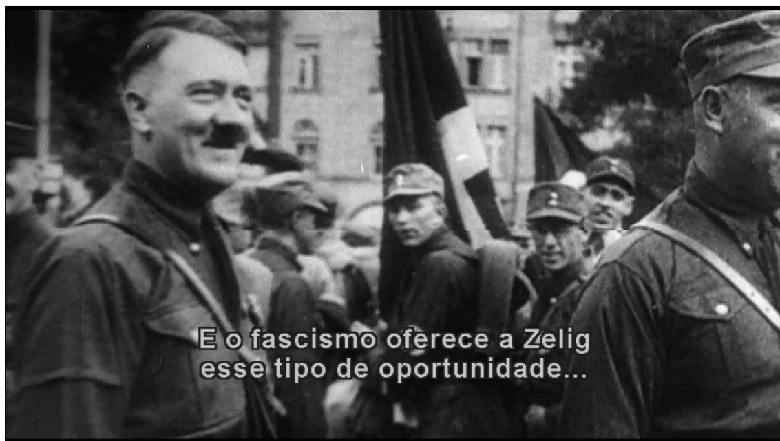
Figura 10: fotograma de Zelig (1983). Tempo: 1:05:18