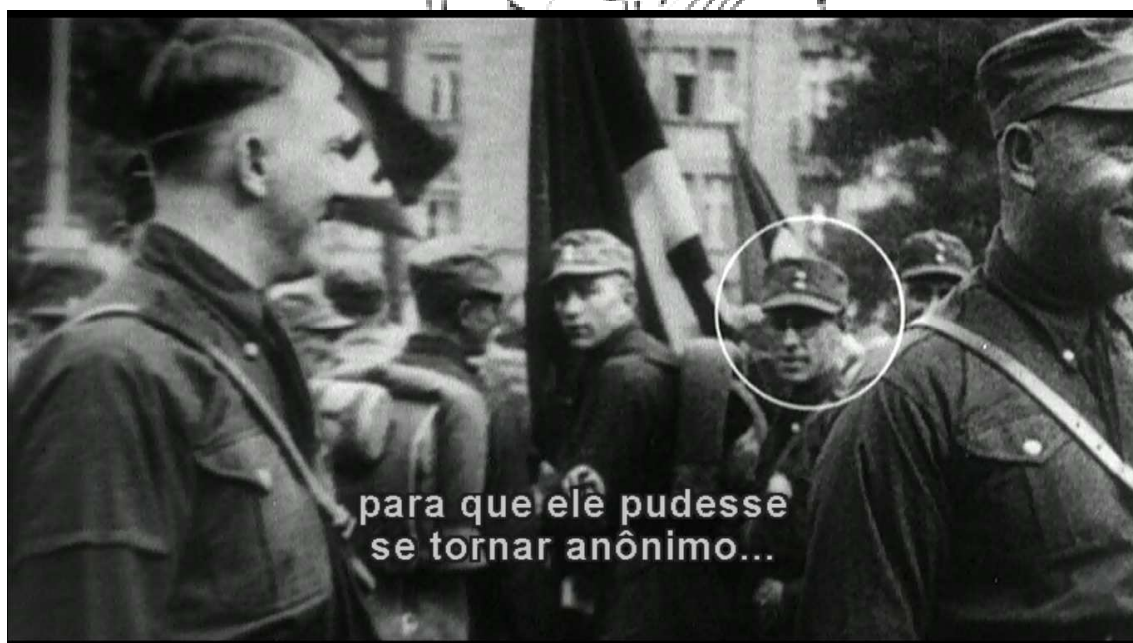
Figura 11: fotograma de Zelig (1983). Tempo: 1:05:24

O ponto de fuga da imagem é a bandeira, representante máxima do nacionalismo pretensamente defendido pelo partido nazista. Em seu centro há um soldado, que olha para Hitler. Numa situação normal, depois do Ditador, esse soldado seria a figura de maior destaque da imagem. Está exatamente no ponto de fuga. Mas não é. Zelig está a sua direita. O