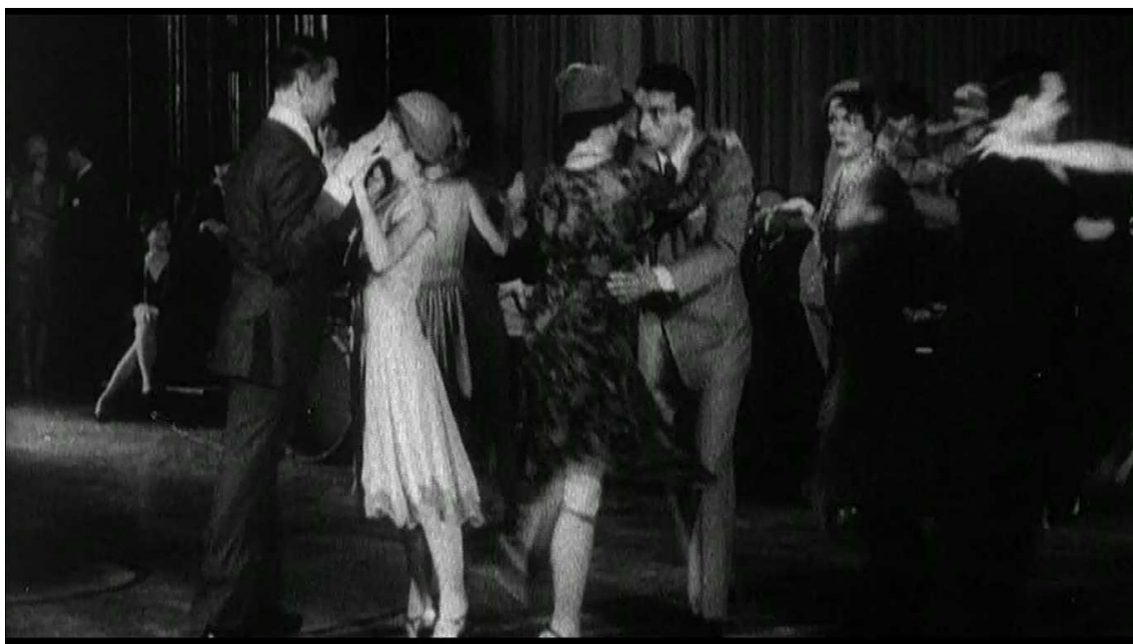
Figura 09: fotograma de Zelig (1983). Tempo: 0:15:34

A fama de Zelig faz com que surjam diversos produtos ligados a sua figura surreal. Uma delas é a popularização da chamada “Dança do Camaleão”. O fotograma selecionado mostra o momento em que casais, embalados pelo ritmo louco advindo da recente Era do Jazz, praticam a dança. Seus passos são marcados por uma junção entre coreografia corporal e facial. Os casais fazem passos emulando camaleões descobertos em um quintal, tentando fugir, alternando movimentos rápidos e relativamente lentos, dando a dança um sentido levemente desconexo. Ao mesmo tempo, mostram as línguas uns para os outros, fazendo caretas que procuram reproduzir o que seria a face reptiliana de um camaleão.