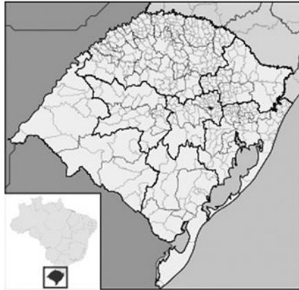
Imagen 1. Mapa do Rio Grande Do sul.

Lajeado es una de ciudad que se encuentra en el Valle del Taquari 4 , en el Estado de Rio Grande do Sur (RS), su organización socio-espacial está formada por más de 20 barrios, tales como: San Cristóbal, Alto del Parque, San Antonio, Morro 25, San Benedicto, entre otros, los cuales están atravesados por el rio Taquari, antiguo canal de comunicación entre el interior del Valle del Taquari con la capital del Estado Porto Alegre (POA). El Estado del Rio Grande del Sur, limita al noroccidente con Argentina, al suroccidente con Uruguay, al norte con Estado de Santa Carina y al oriente con el Océano Pacífico.