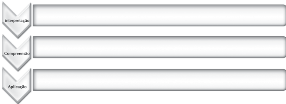
Imagen 3. Aplicación