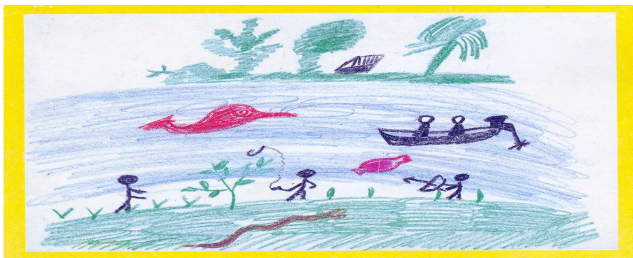
Figuração de uma criança de nove anos representando uma pescaria da Comunidade Rio Madeira em 2000.

Como a criança representou a sua vida por meio de uma narrativa de imagens, pedimos que contasse oralmente para os colegas o que havia representado. Na oportunidade, perguntávamos: “A criança que está pescando é você? Quem são as outras pessoas que estão no desenho, são seus amigos? Você os conhece? Quem são os ocupantes do barco? Vocês pegaram muitos peixes?” Em seguida, pedimos que contasse oralmente a história daquele dia, ela narrou o seguinte: