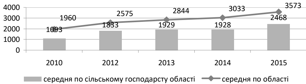
Рис. 2. Динаміка середньомісячної заробітної плати працівників сільськогосподарських підприємств, грн [6]

На рисунку 2 показано динаміку середньомісячної заробітної плати працівників у сільськогосподарських підприємствах області.