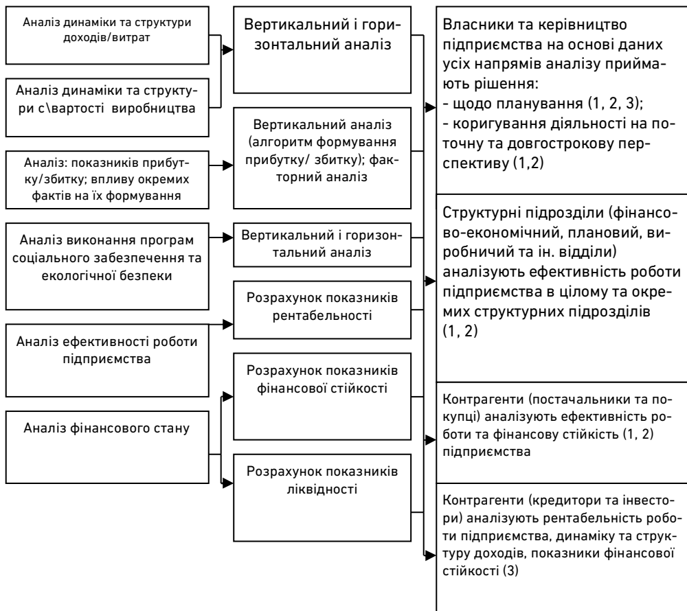
Рис. 2. Модель використання аналітичної інформації для управління промисловим підприємством: 1 – великі підприємства; 2 – середні підприємства; 3 – малі підприємства (розроблено з використанням та узагальненням [2; 7; 8])

Завдяки аналітичній побудові рахунків дані управлінського обліку дають можливість використовувати кількісні показники для визначення: вартісної оцінки активів та пасивів за центрами відповідальності та по підприємству в цілому; прибутковості за видами діяльності підприємства; життєвого циклу продуктів та послуг, їх продажу, оптимальні ціни; прибутковості (або навпаки – збитковості) окремих підрозділів виробничого підприємства; клієнтської бази, аналізу діяльності кожного клієнта та прибутковості окремих клієнтів.