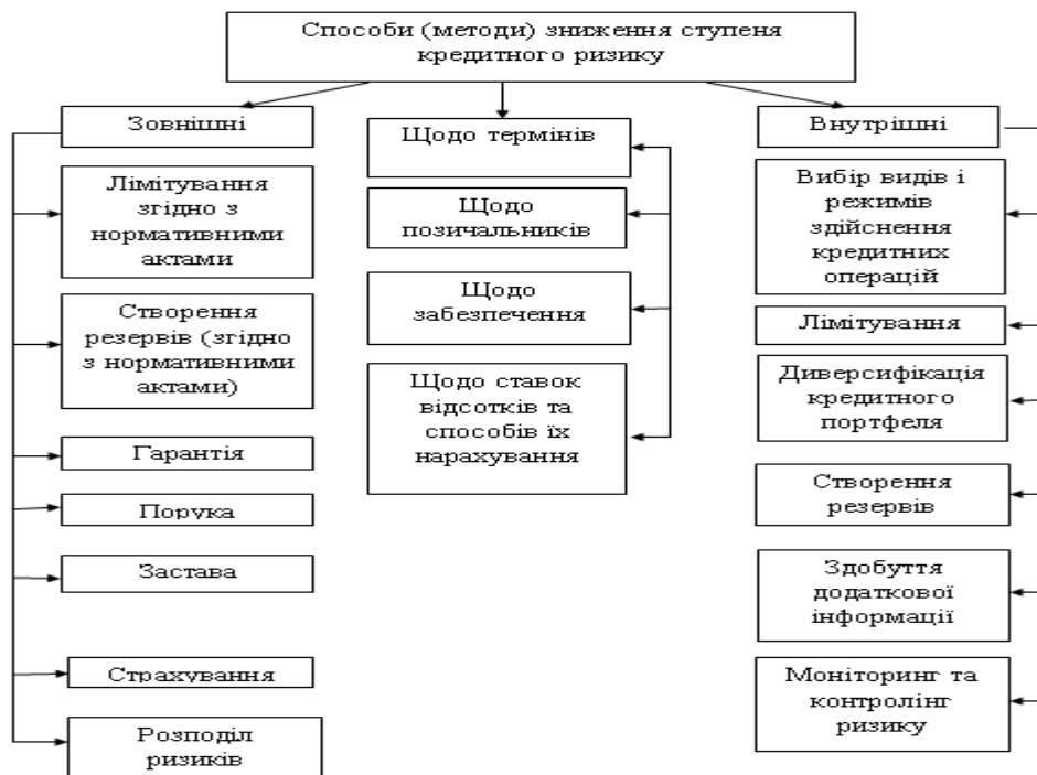
Рис. 2. Основні методи зниження ступеня кредитного ризику

Основні методи зниження ступеня кредитного ризику наведено на (рис. 2).