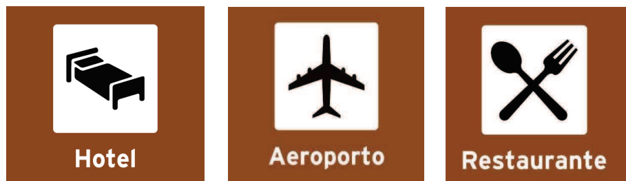
Figura 1 – Placas de atrativos turísticos

consiste o local sinalizado, aparece, em geral, uma pequena ilustração considerada representativa desse local ou serviço (por vezes, a imagem é o único elemento da placa).