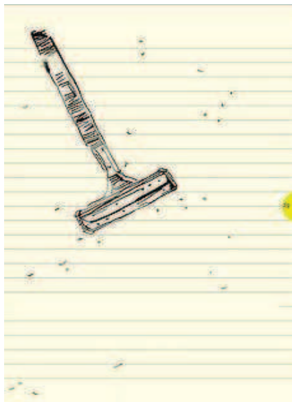
Figura 3 – Ilustração de Sou eu!

Por conta do limite de páginas do trabalho, restringimos nossa análise a um único exemplo desses elementos: uma das ilustrações. Em Sou eu! , notam-se marcas claras do modo como as ilustrações compõem, com a narrativa escrita, formas diferenciadas de representação da adolescência enquanto período de transição para a vida adulta. Por meio delas, sustentam-se alguns elementos fundamentais à narrativa, e é também por meio delas que se confirmam e se constroem determinadas possibilidades de interpretação a respeito do desenrolar misterioso do enredo.