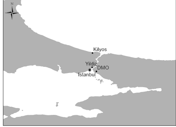
Şekil 1. Örnekleme noktalarının gösterimi

İstanbul'da PAH'ların ve TSP'nin atmosferik konsantrasyonu şehir atmosferini karakterize etmek için üç ayrı noktada ölçülmüştür (Şekil 1).